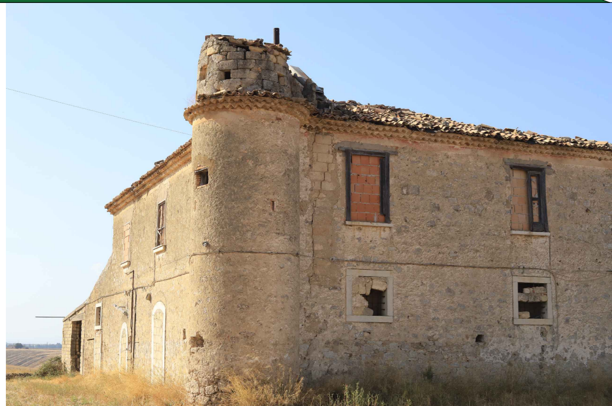
7_Masseria Saraceno Quaranta