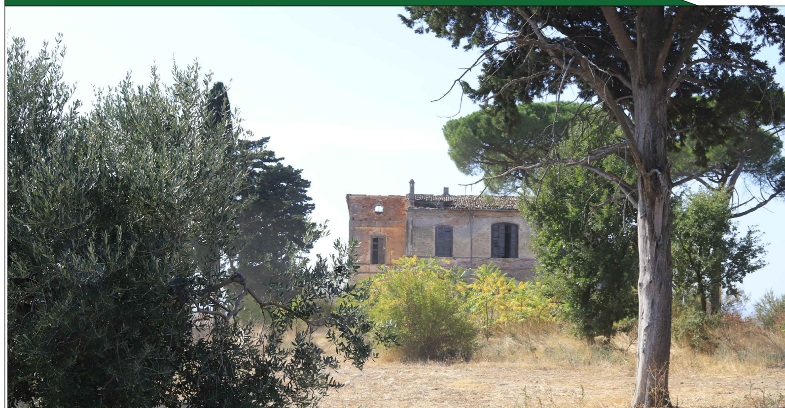
Foto Bene 8_Masseria Trentangeli