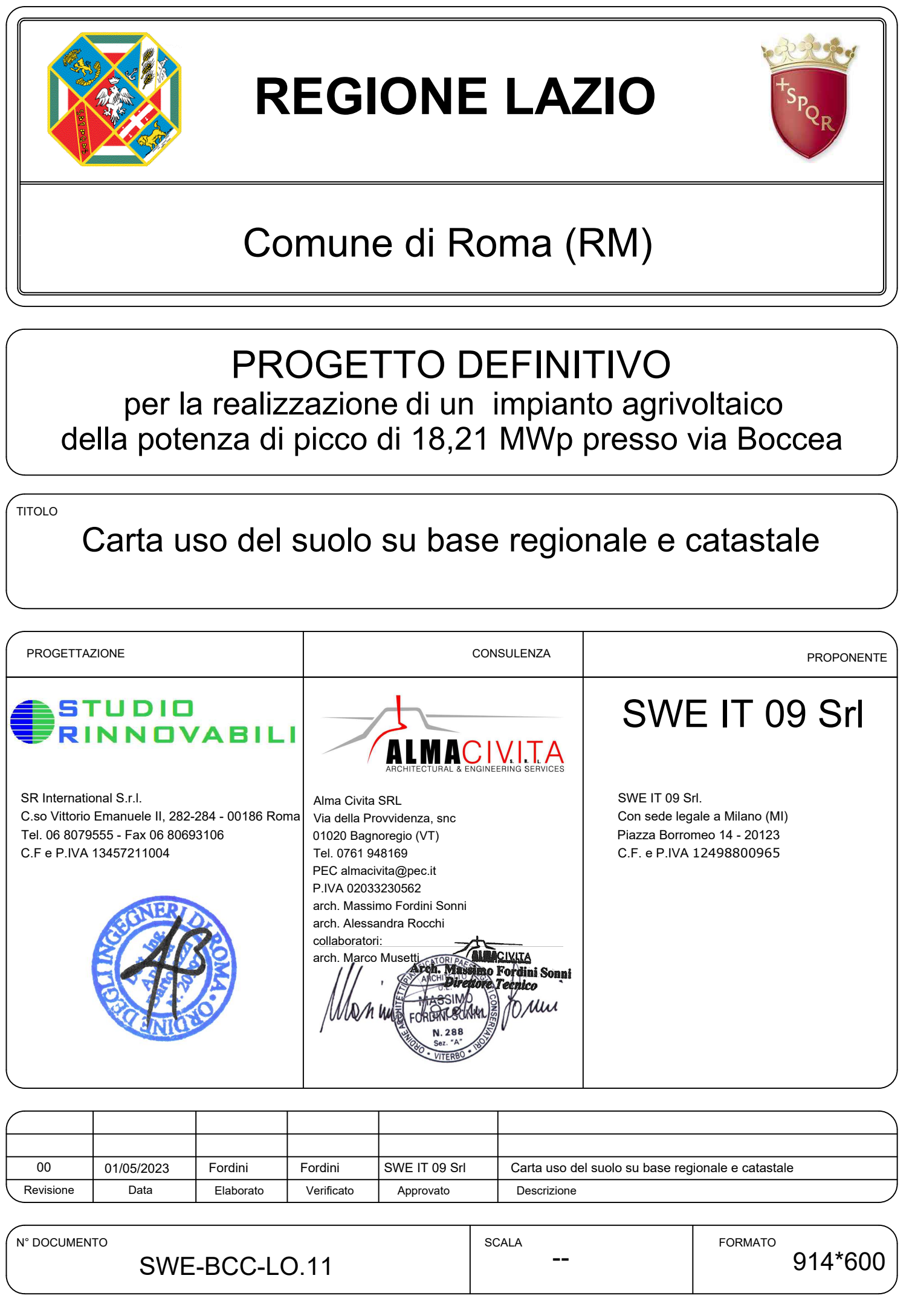
Carta uso del suolo su base catastale - scala 1:5000