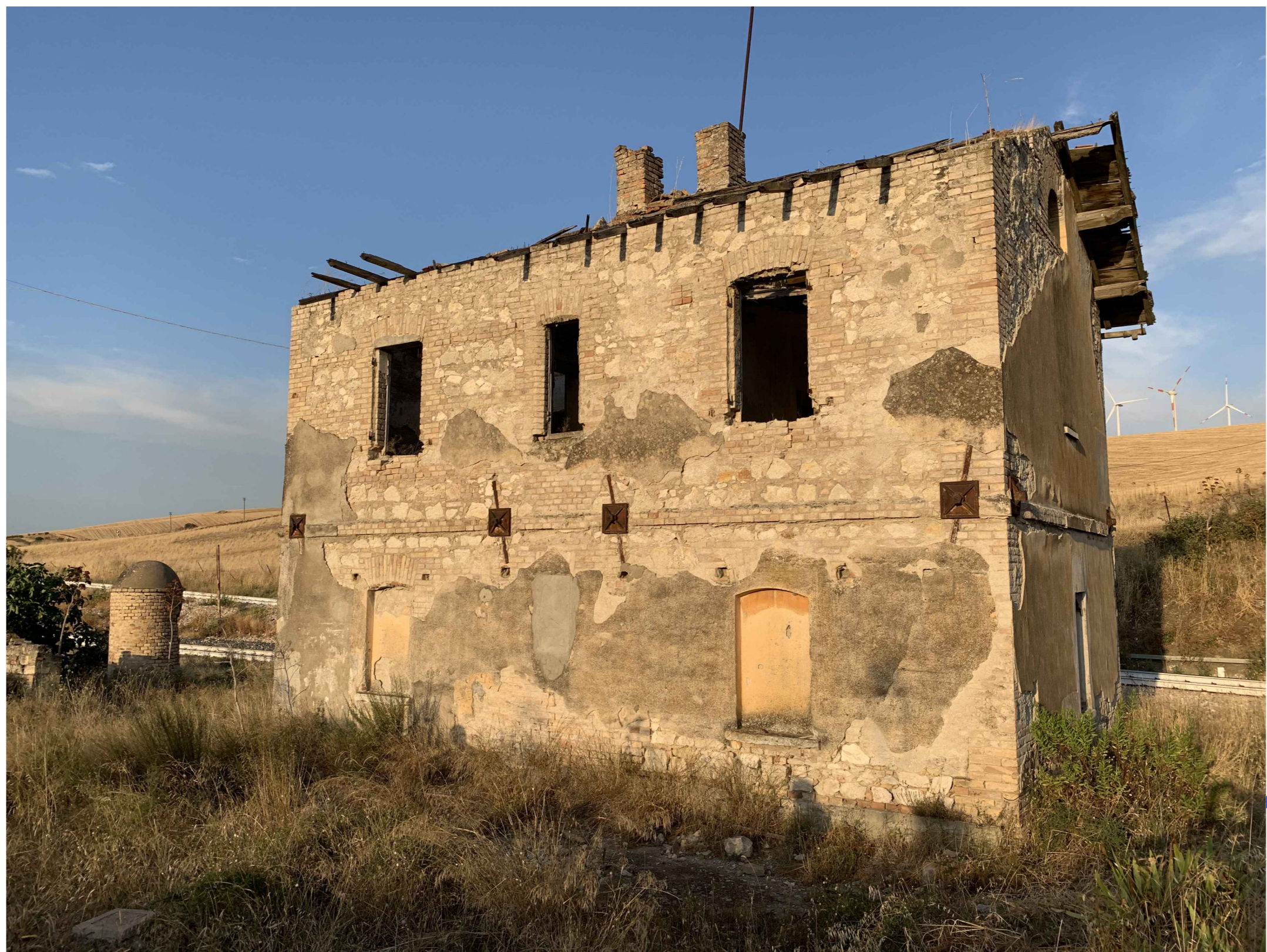
Fabbricato FS esistente da adeguare per alloggiamento CABINA TE