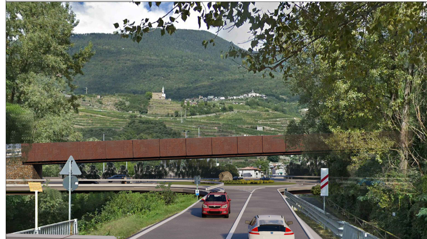
FOTO 03 - STATO ATTUALE