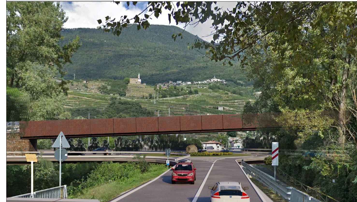
FOTO 03 - STATO ATTUALE