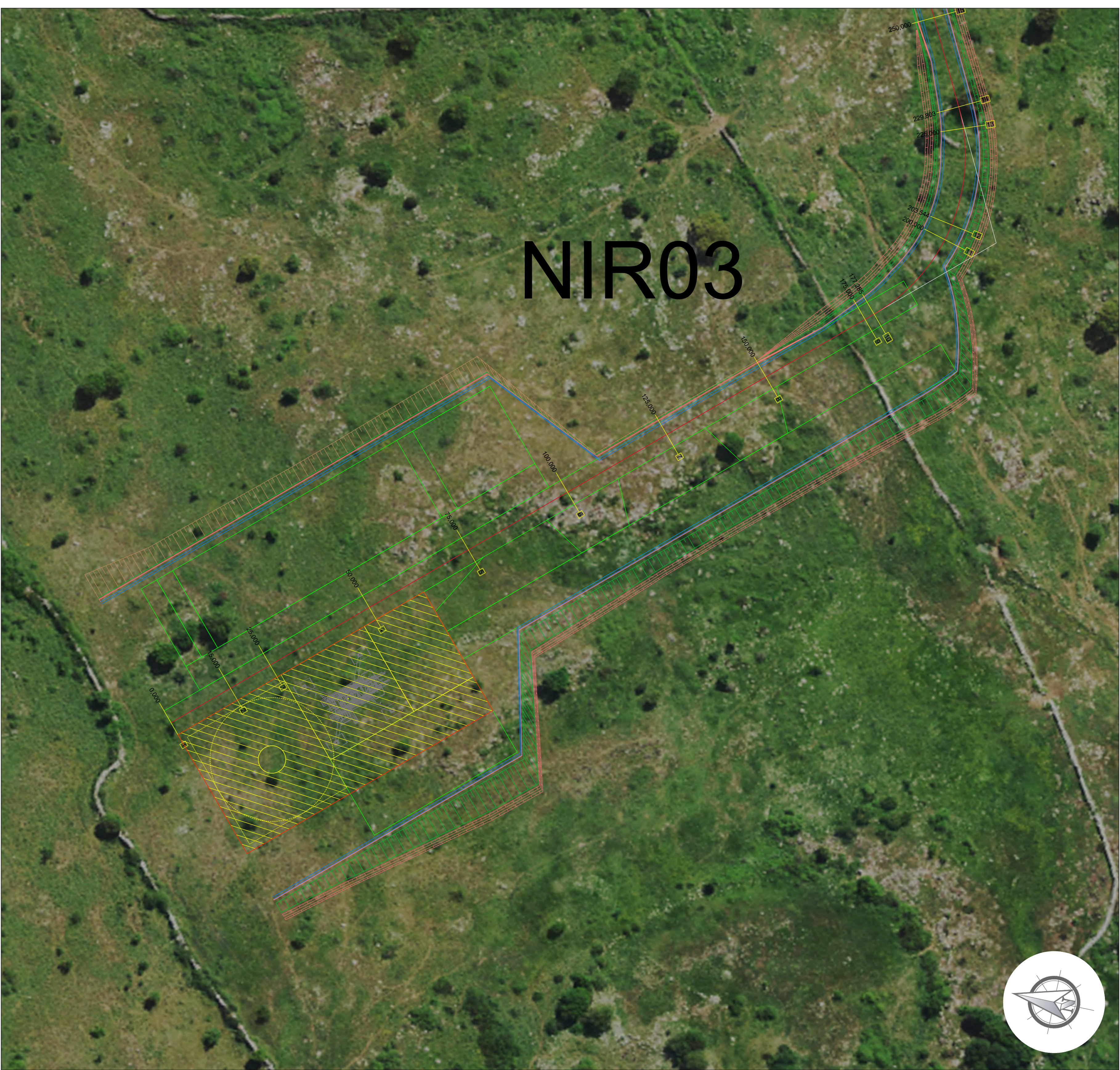
PLANIMETRIA PIAZZOLA DI SERVIZIO AEROGENERATORE Scala 1:500