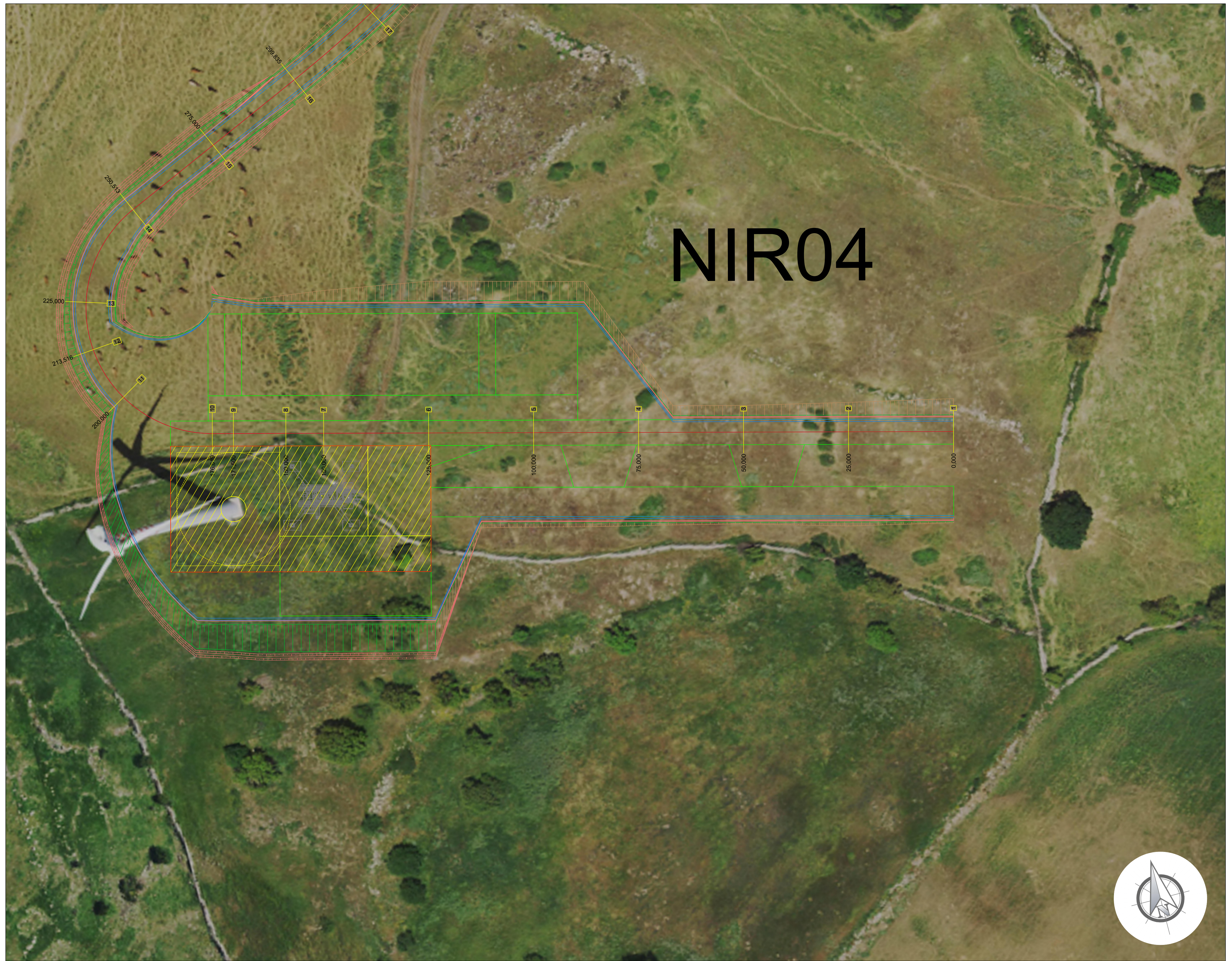
PLANIMETRIA PIAZZOLA DI SERVIZIO AEROGENERATORE Scala 1:500