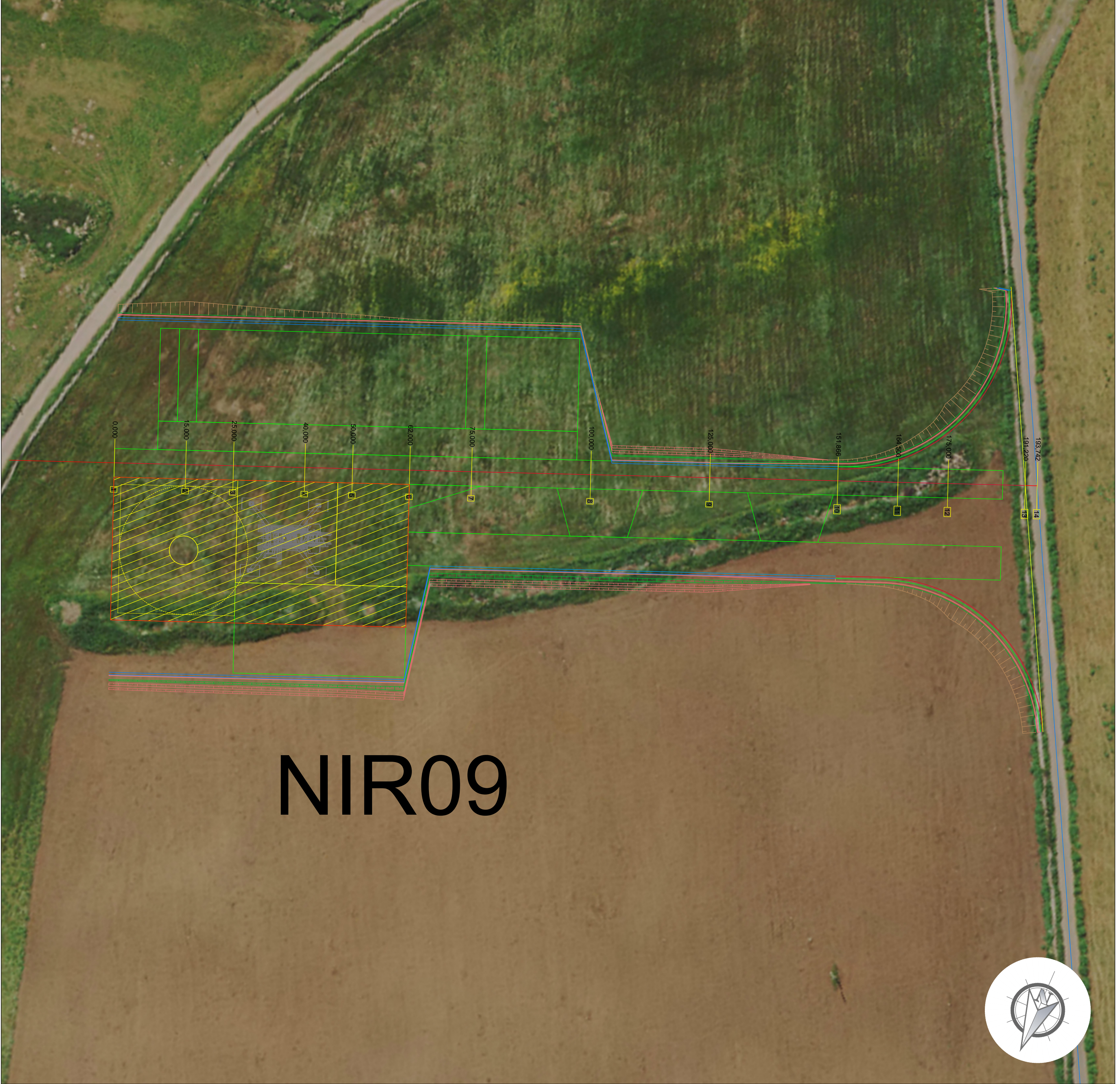
PLANIMETRIA PIAZZOLA DI SERVIZIO AEROGENERATORE Scala 1:500