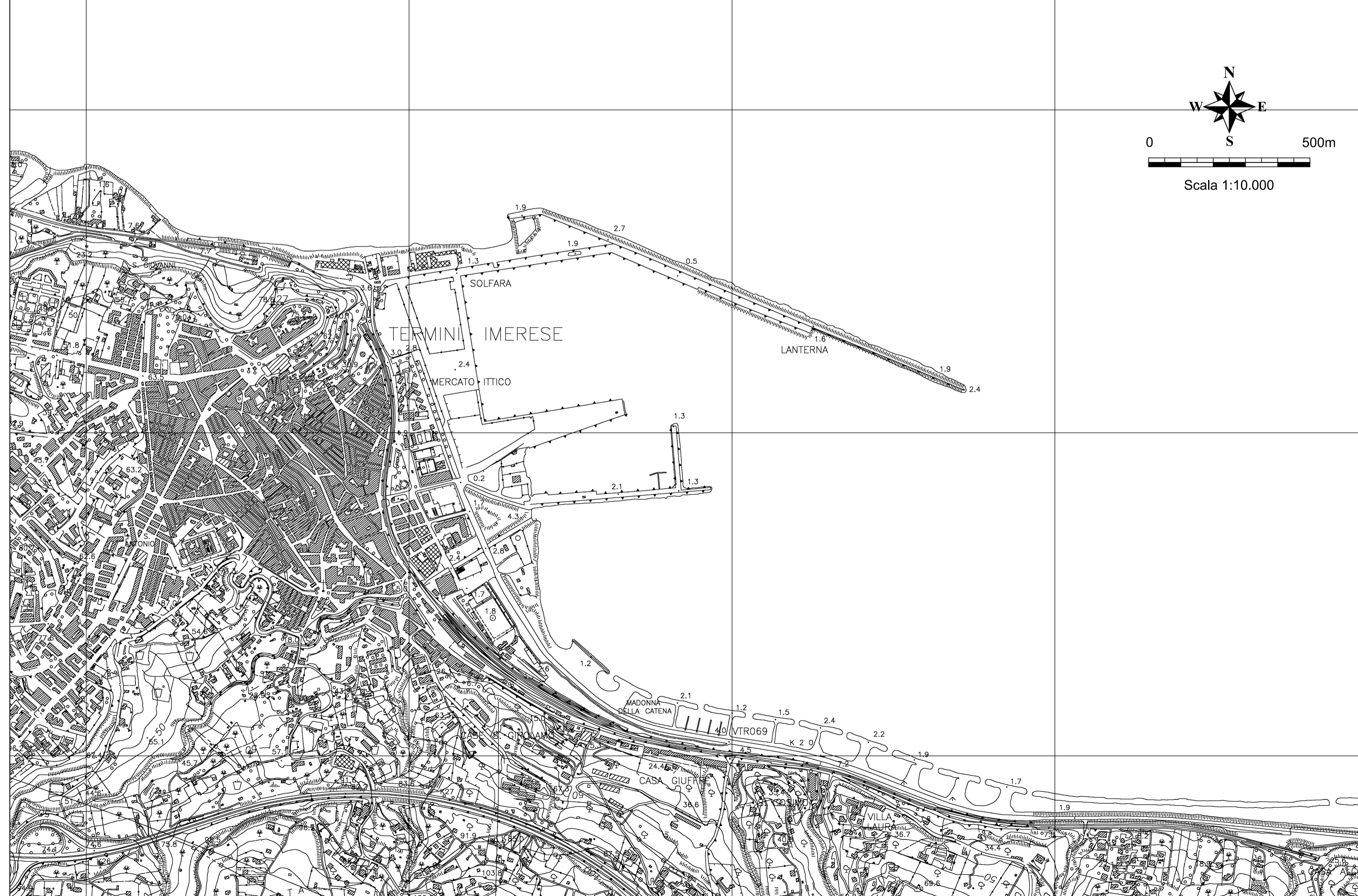
Stralcio Carta Tecnica della Regione Siciliana - Sezione 609010 - scala 1:10.000