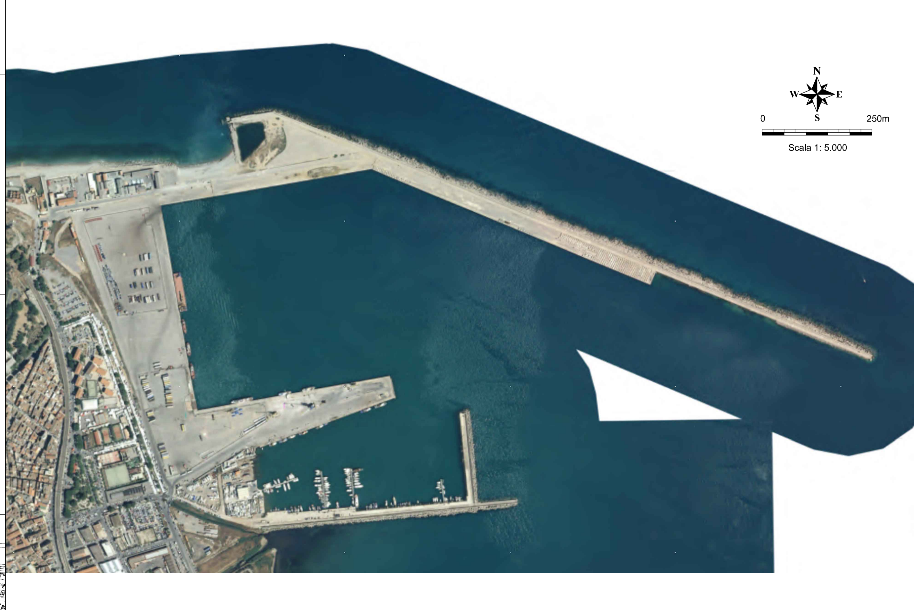
Ortofoto ATA 2007/2008 - scala 1:5.000