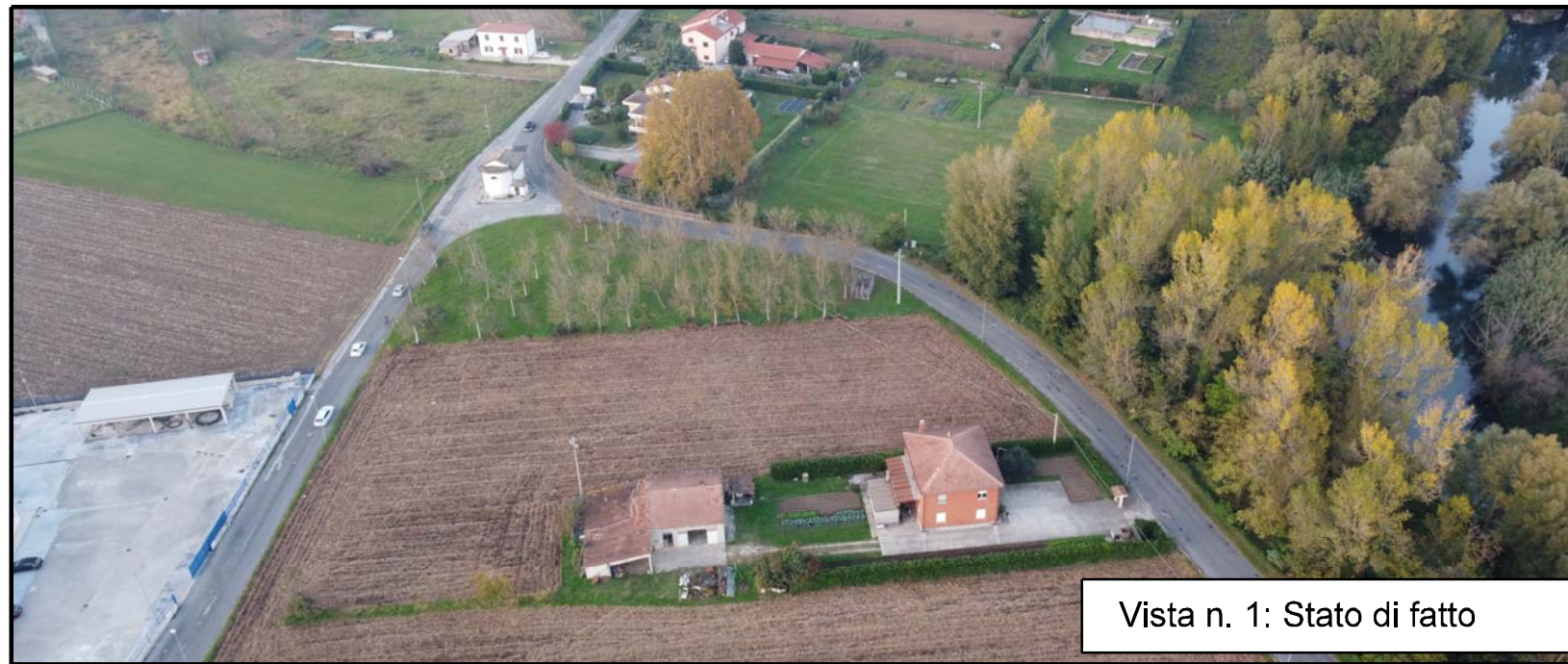
Vista n. 1: Stato di fatto