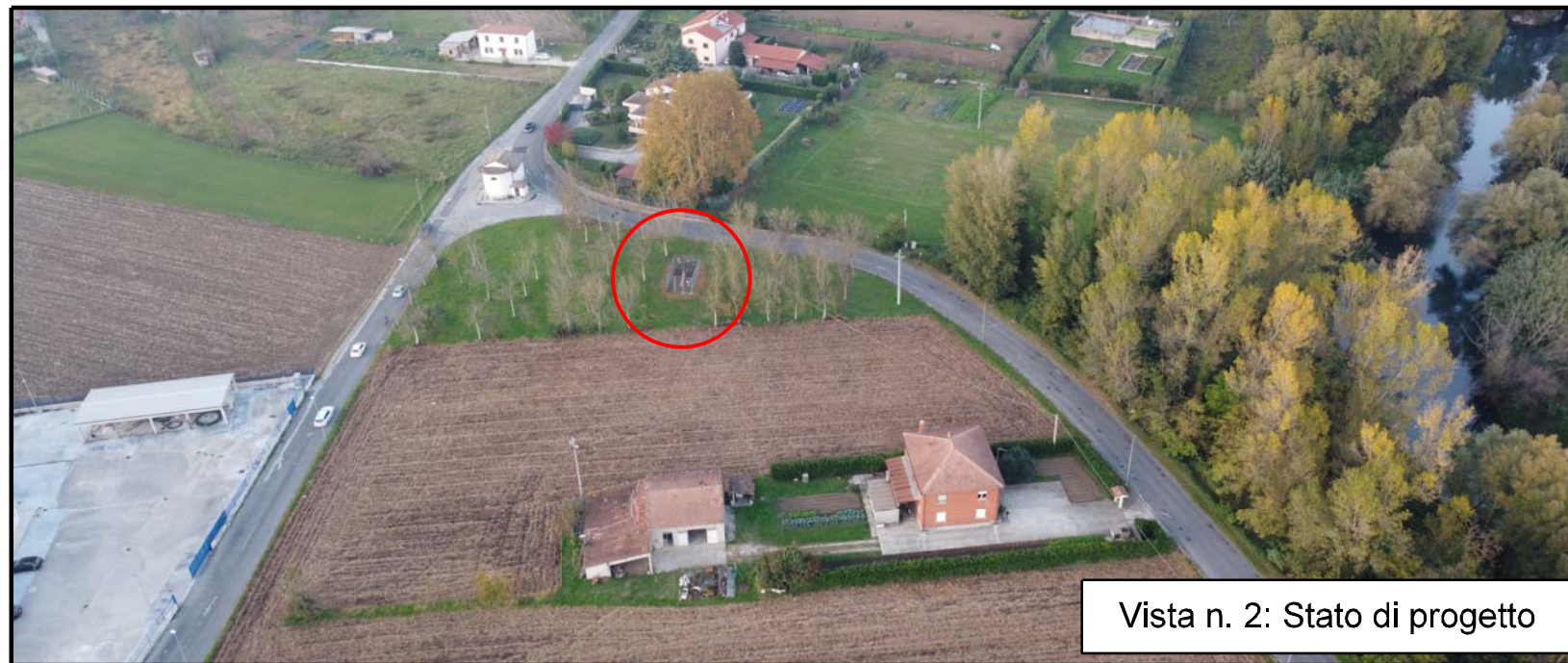
Vista n. 2: Stato di progetto