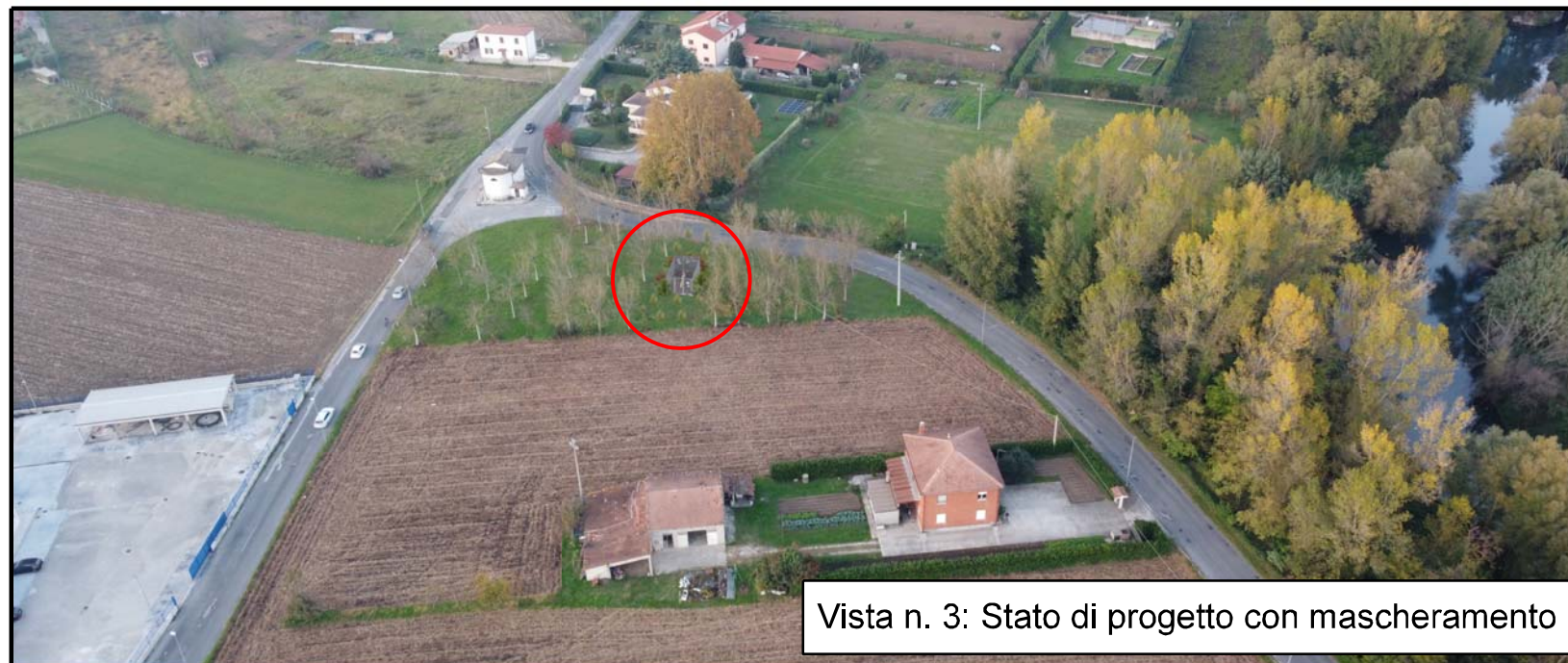
Vista n. 3: Stato di progetto con mascheramento