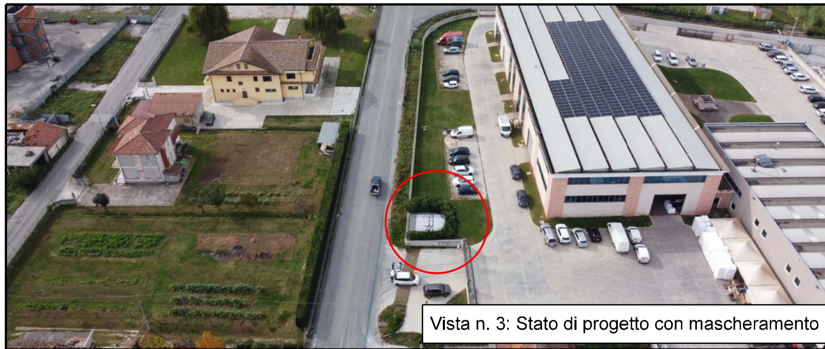
Vista n. 3: Stato di progetto con mascheramento