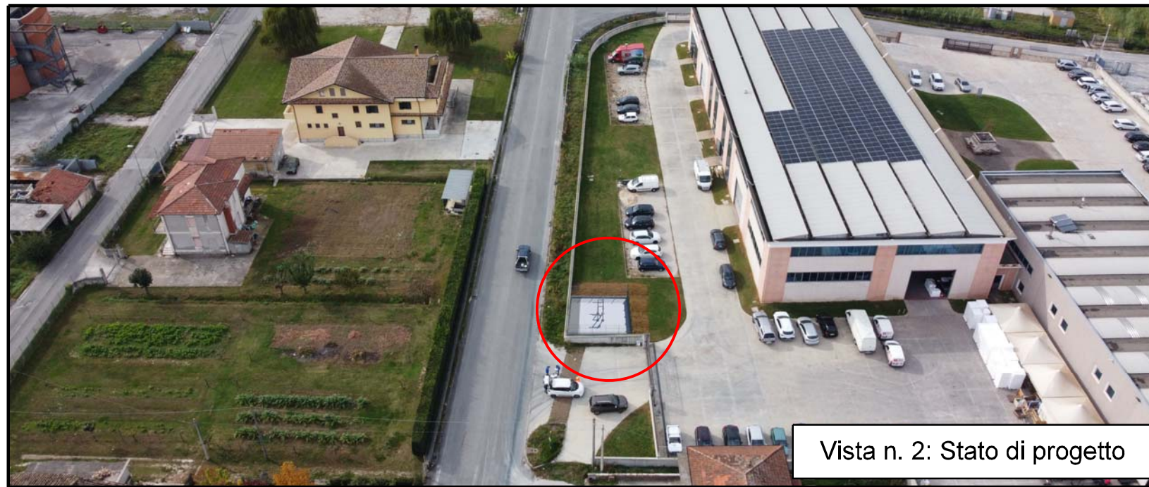
Vista n. 2: Stato di progetto