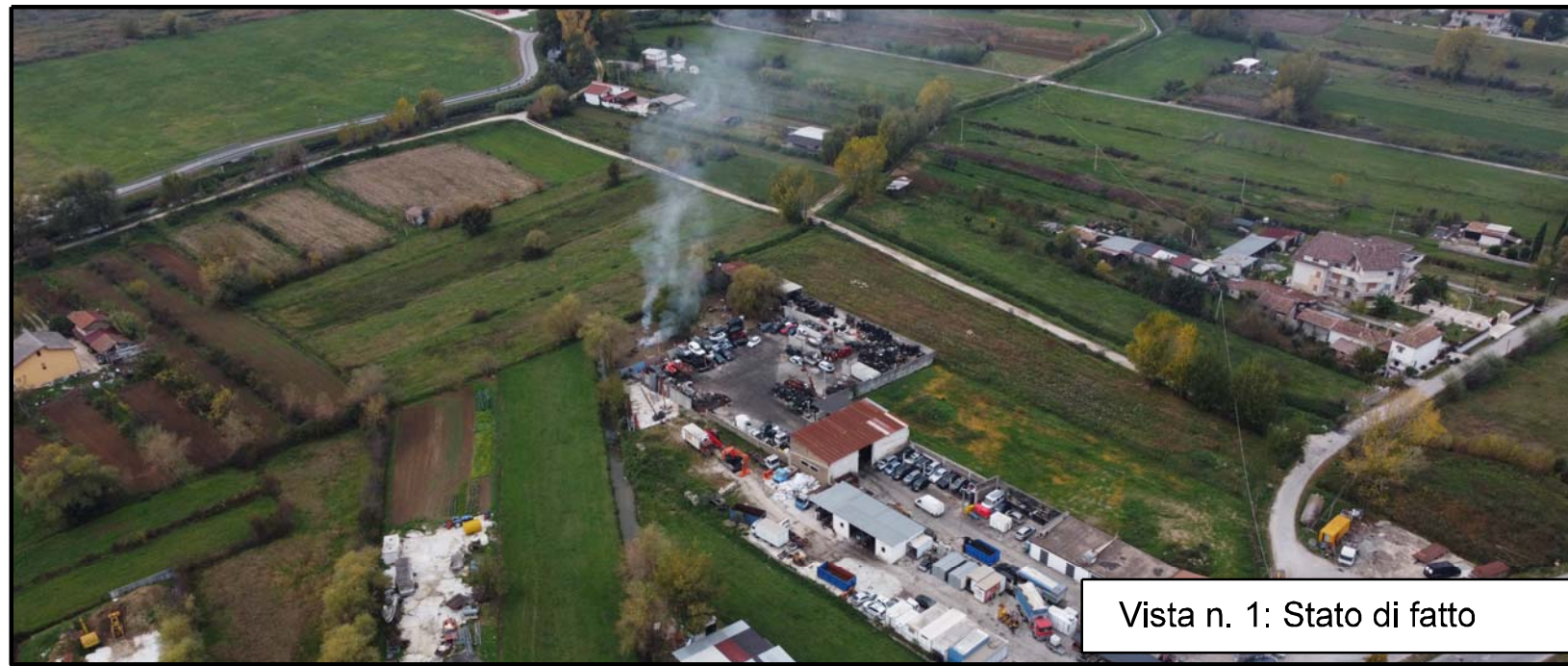
Vista n. 1: Stato di fatto