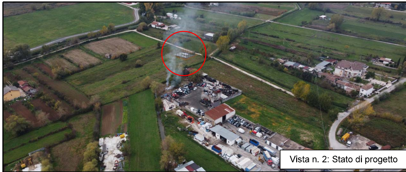
Vista n. 2: Stato di progetto