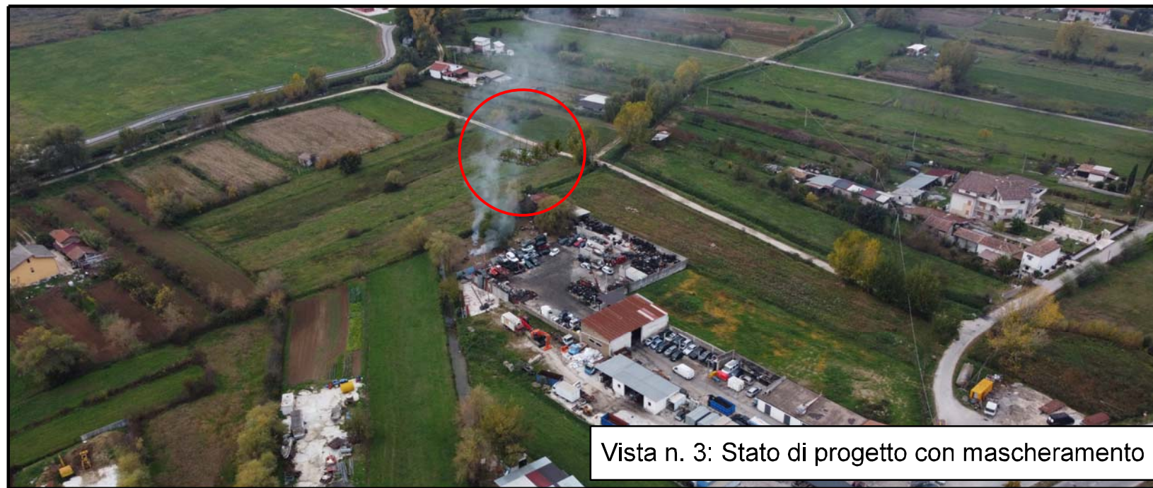
Vista n. 3: Stato di progetto con mascheramento