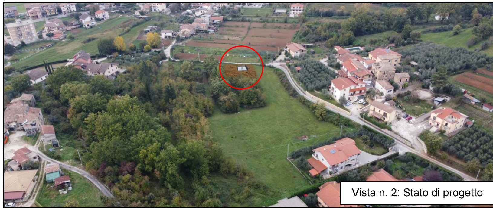
Vista n. 2: Stato di progetto