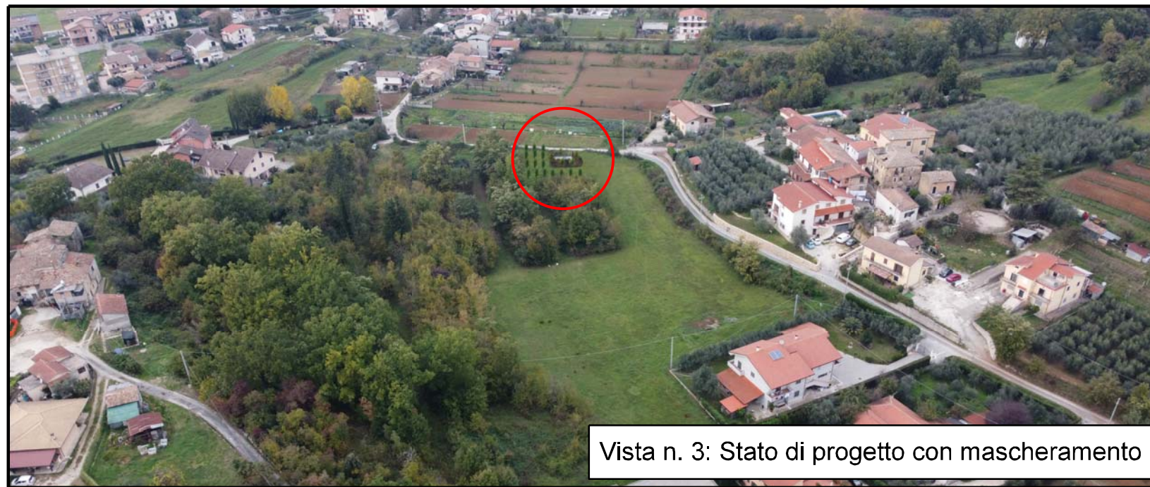
Vista n. 3: Stato di progetto con mascheramento