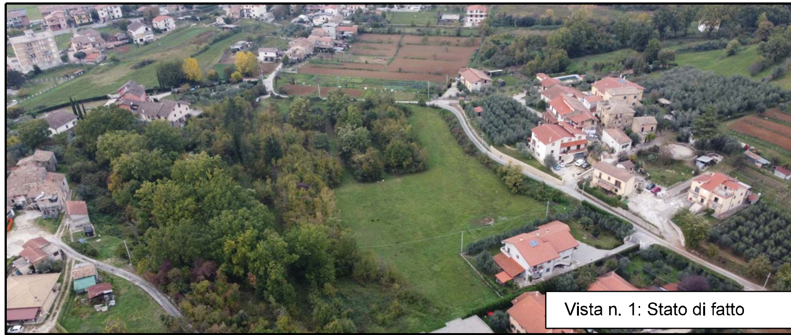
Vista n. 1: Stato di fatto