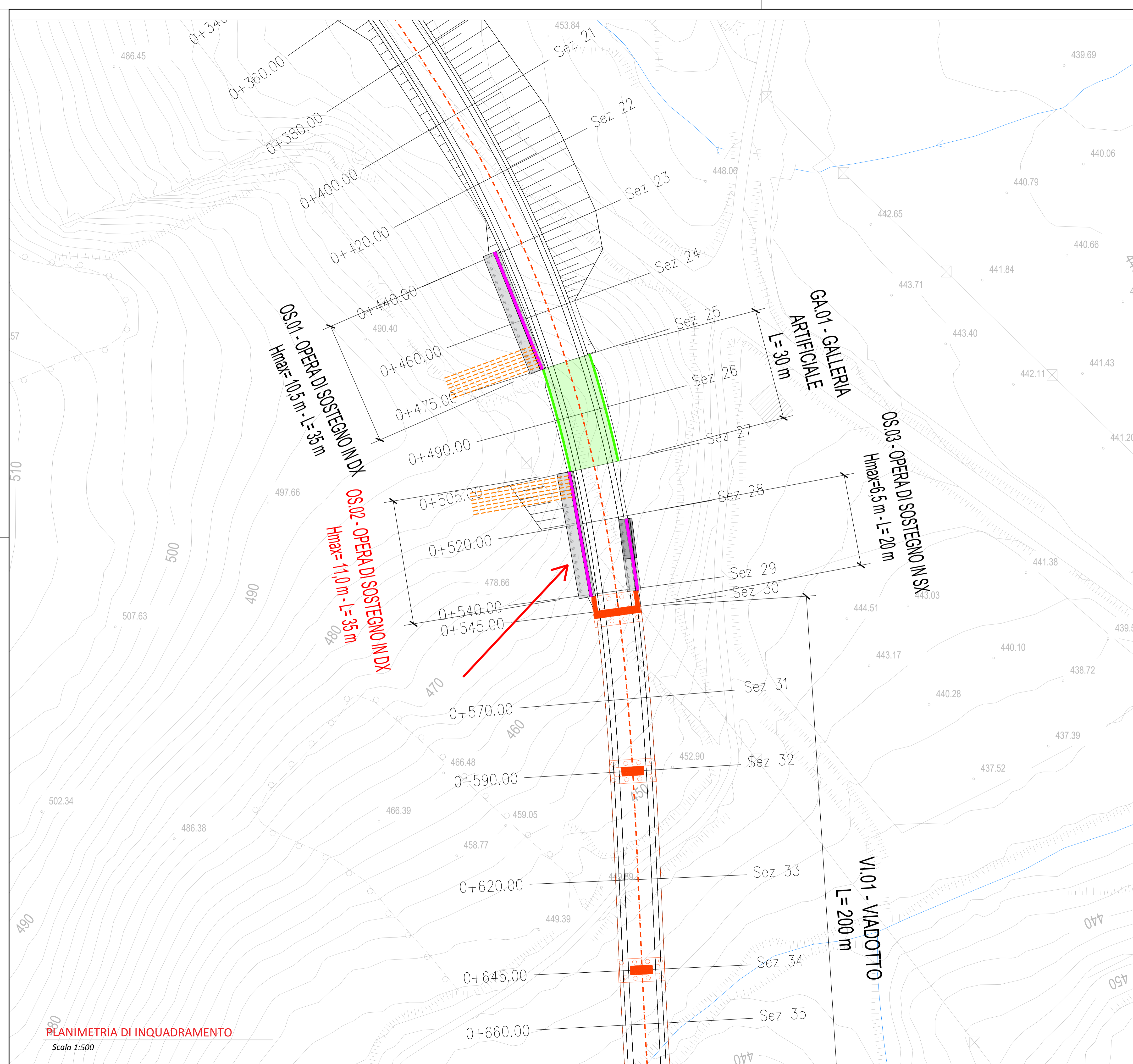
PLANIMETRIA DI INQUADRAMENTO Scala 1:500