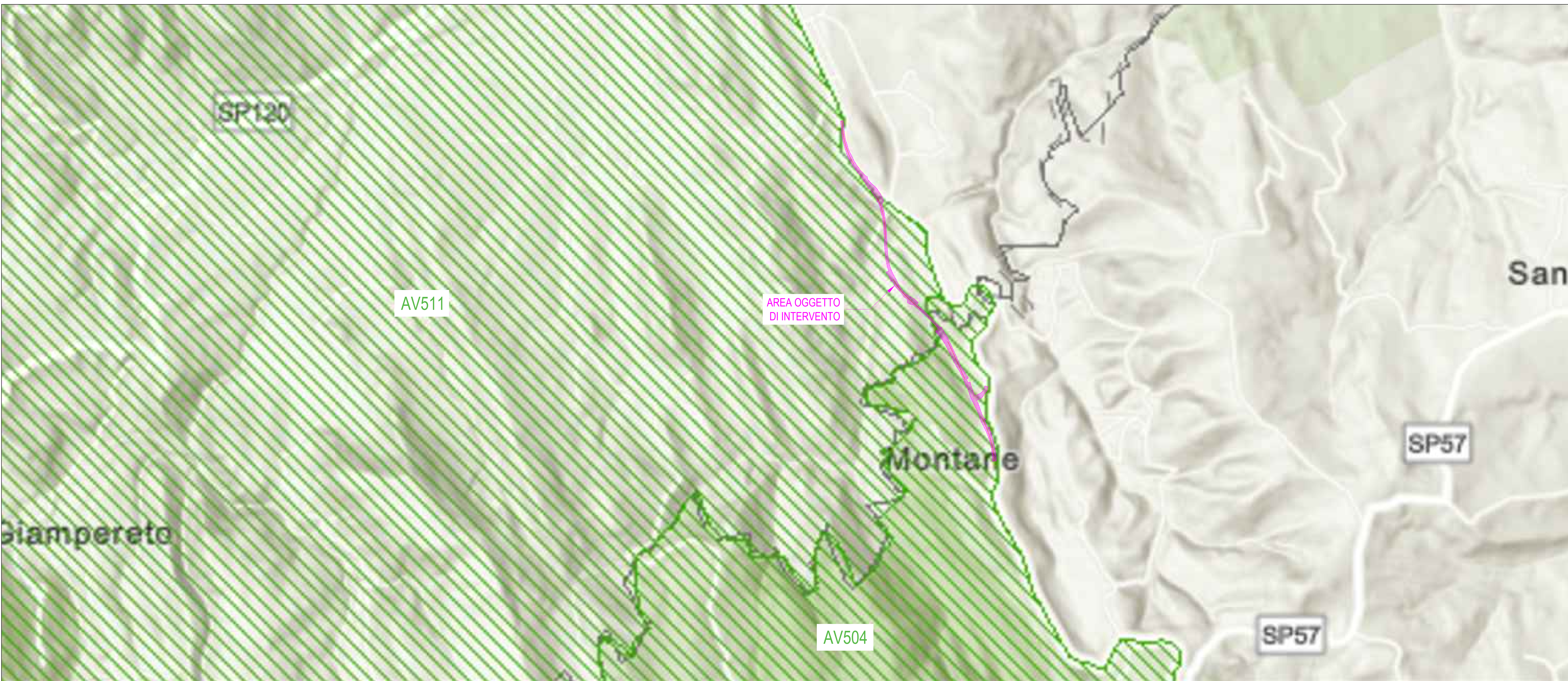
Perimetrazione del vincolo AV511 su CTR