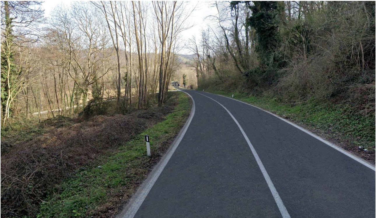
Post-intervento n. 2