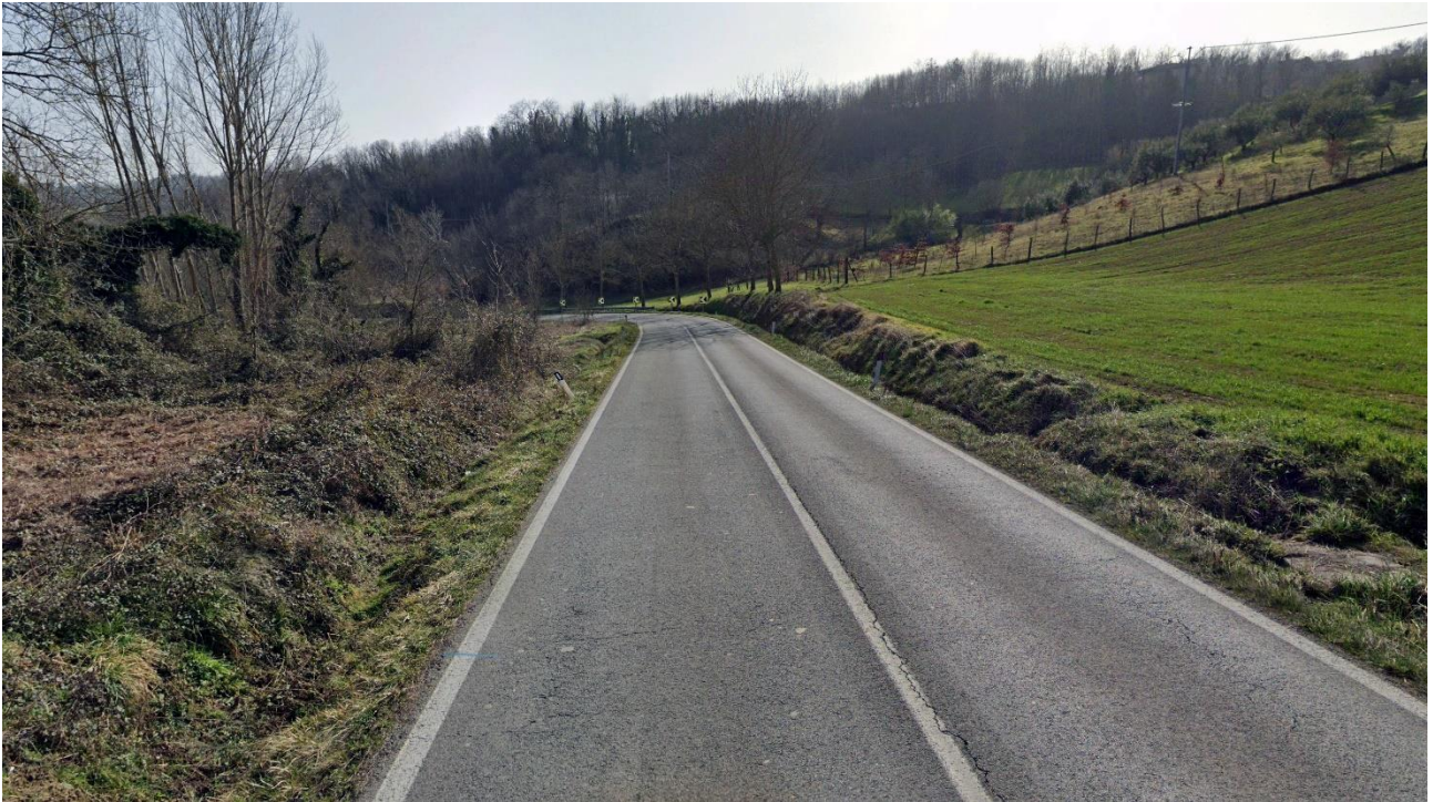
Ante-intervento n. 1