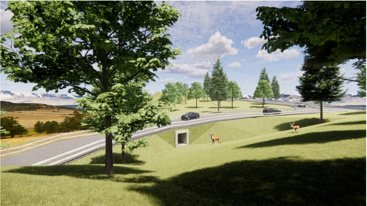
Post-intervento n. 3 – attraversamento scatolare