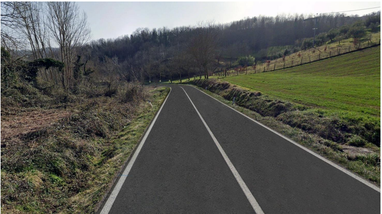
Post-intervento n. 1