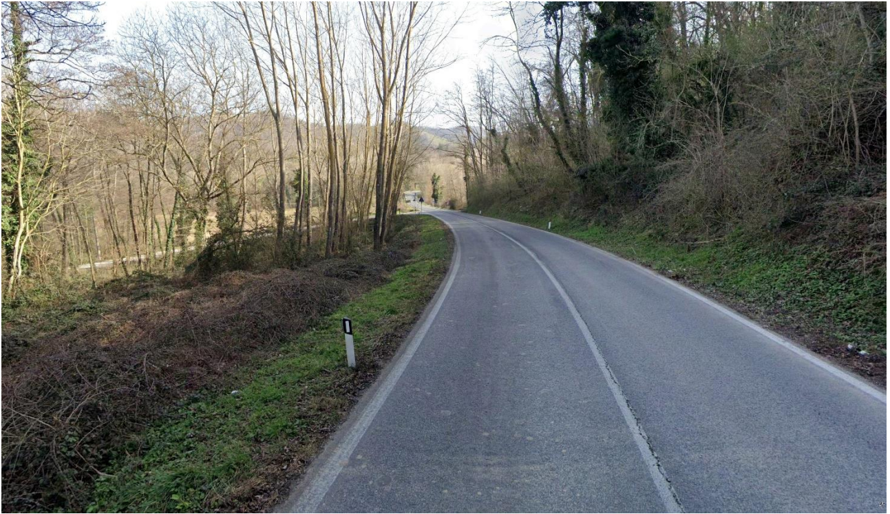
Ante-intervento n. 2