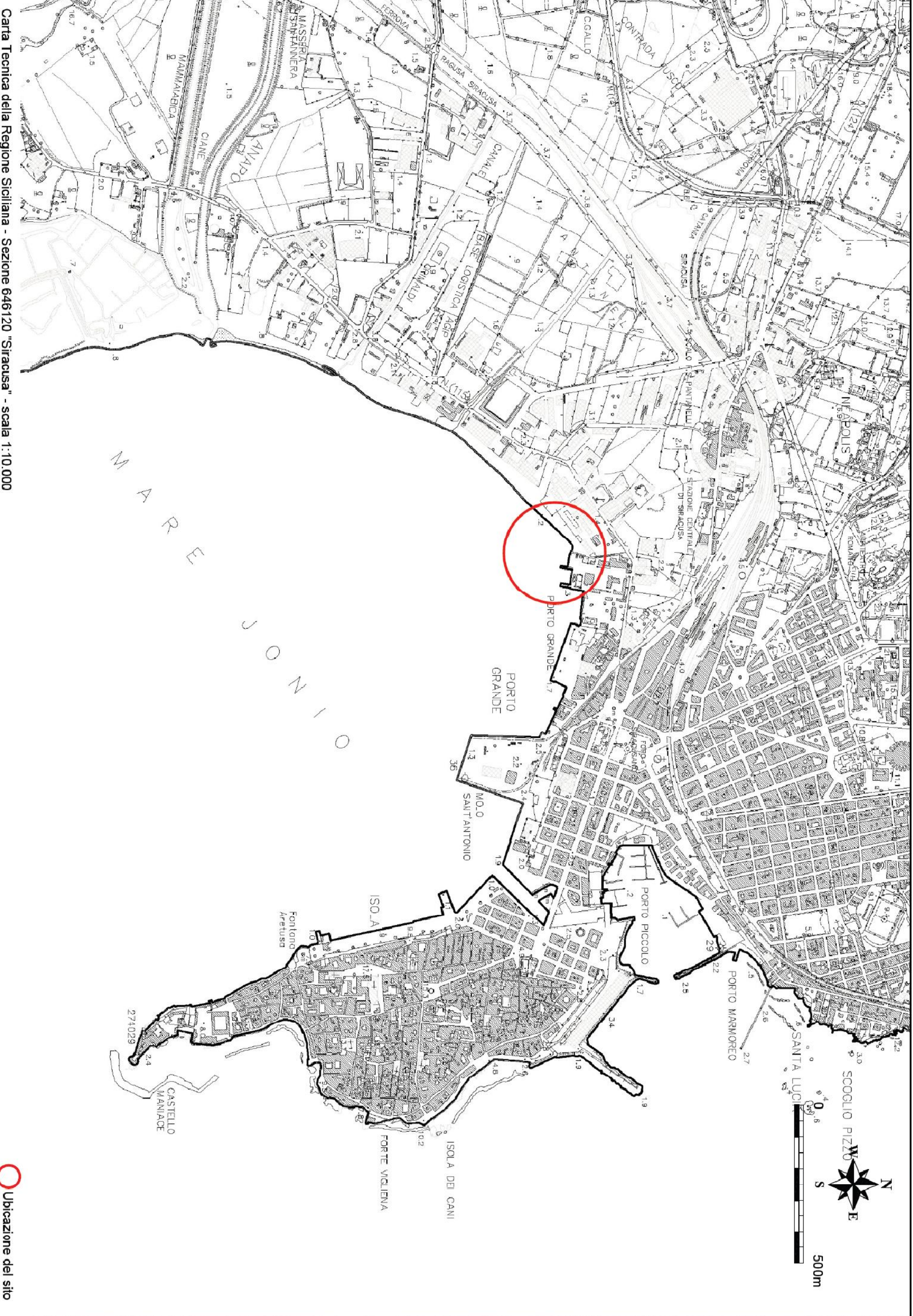
Carta Tecnica della Regione Siciliana - Sezione 646120 "Siracusa" - scala 1:10.000