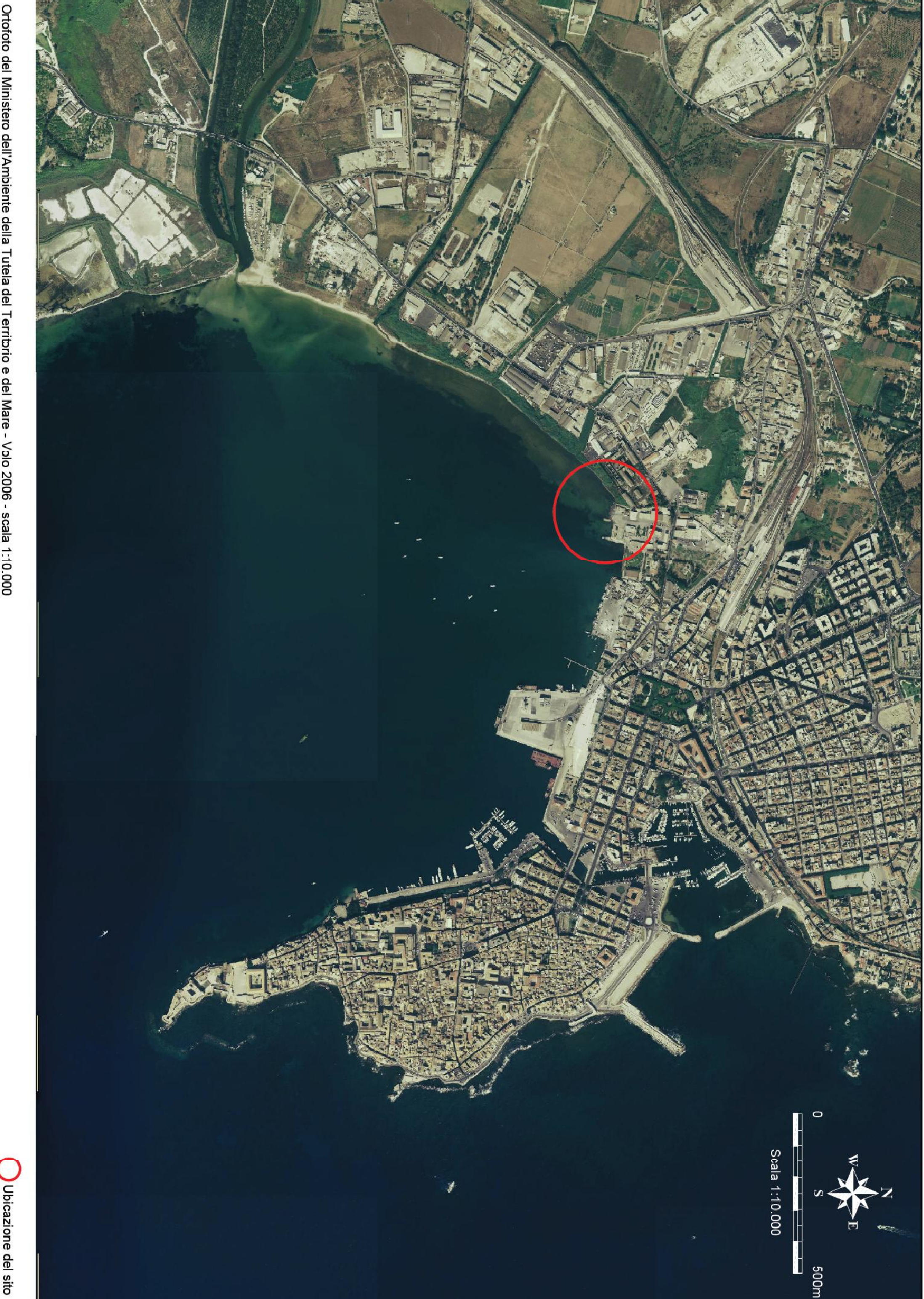
Ortofoto del Ministero dell'Ambiente della Tutela del Territorio e del Mare - Volo 2006 - scala 1:10.000