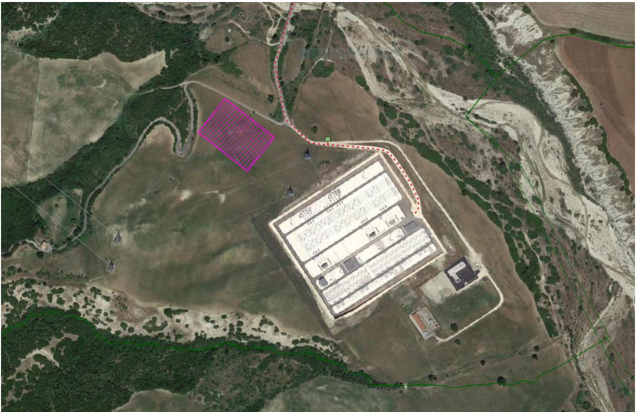
Figura 2 -Ipotesi posizionamento futura SE-Terna (in viola), in verde posizionamento Stazione di Consegna