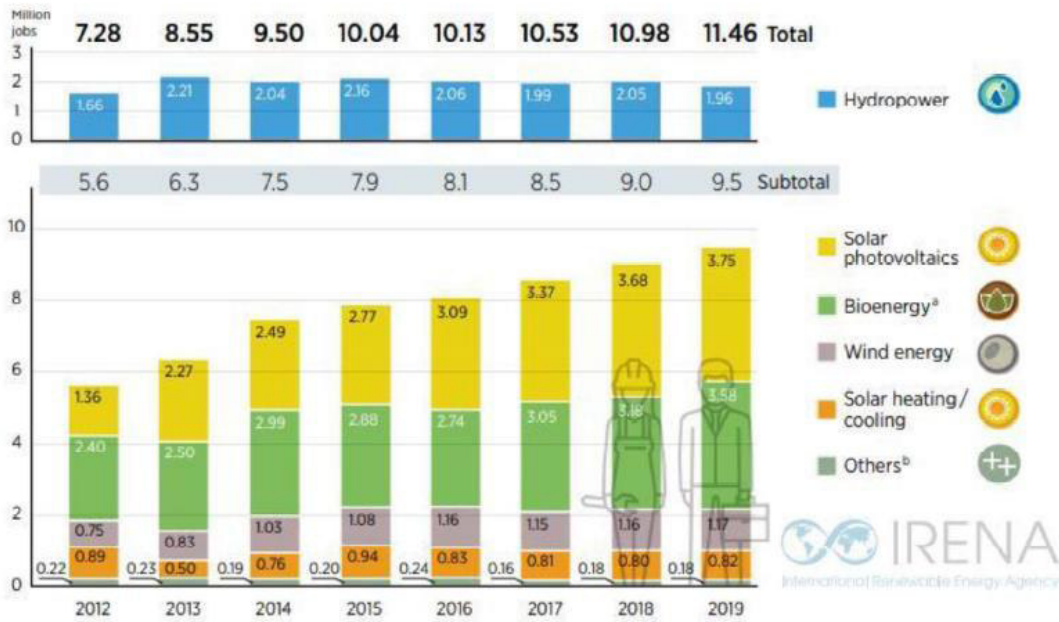
Figura1: Dati occupazionali nel settore rinnovabile negli ultimi anni

L'industria del solare fotovoltaico mantiene il primo posto, con il 33% della forza lavoro totale delle energie rinnovabili. Nel 2019, l'87% dell'occupazione globale nel fotovoltaico si è concentrato nei dieci paesi in testa distribuzione mondiale e nella produzione di attrezzature.