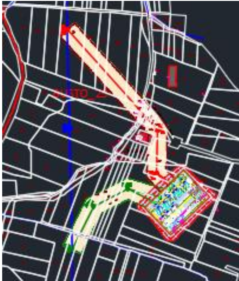
Figura 1: Schema di connessione alla RTN della Futura SE di trasformazione Buseto 2 150/36kV con entra-esce della Linea DT 150 kV “Buseto Palizzolo–Fulgatore” e “Buseto Palizzolo–Castellammare Golfo”