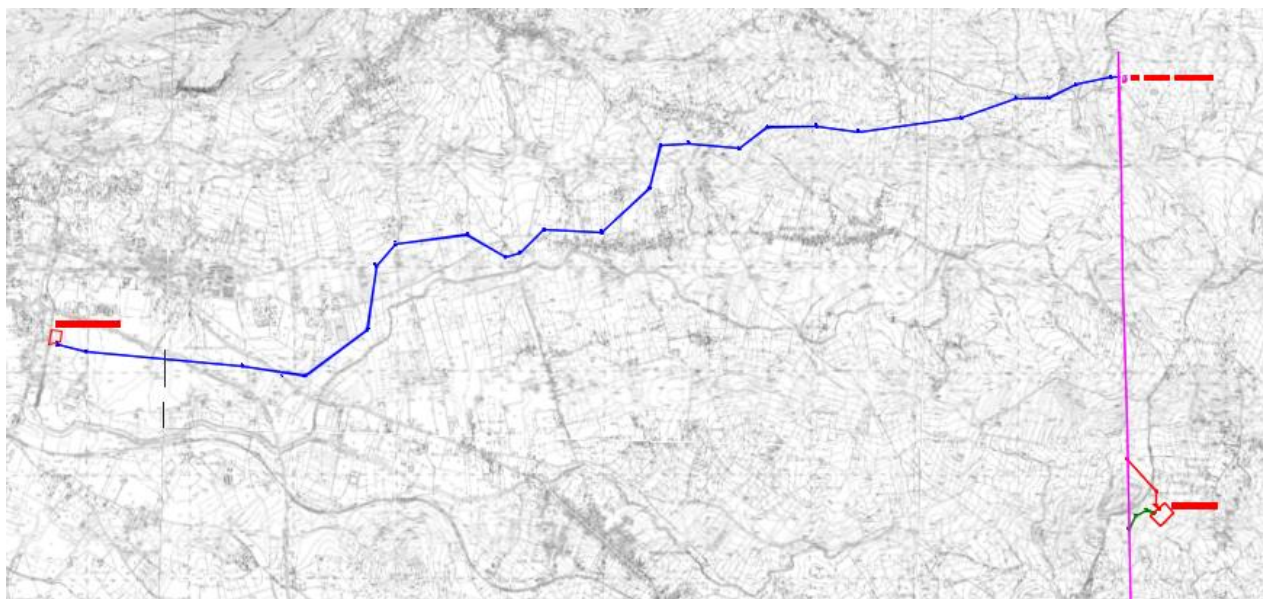
Figura 2: Tracciato elettrodotti 150 kV

I terreni che saranno attraversati sono agricoli.