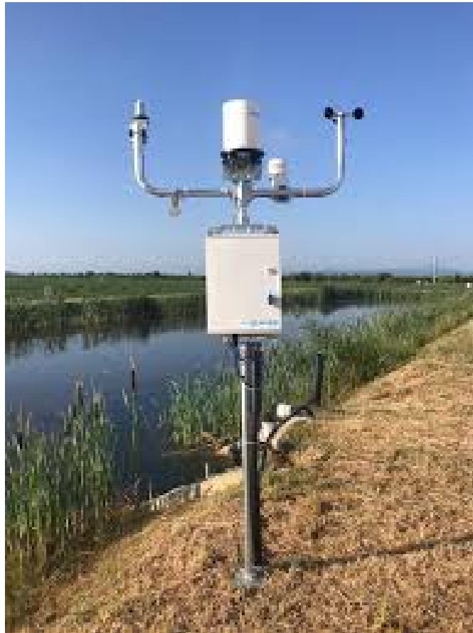
Figura 5 - Esempio di stazione meteoclimatica multi-parametrica

Durante la fase di cantiere verranno adottate tutte le accortezze per la mitigazione degli impatti, tra cui: