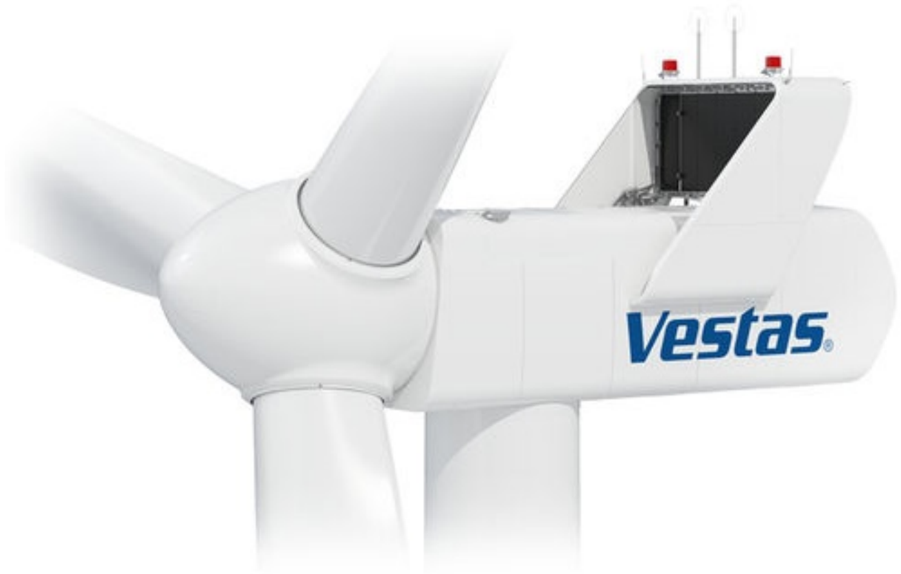
Figura 4 - Vista frontale del rotore della turbina Vestas; sono visibili i due anemometri e le luci di segnalazione