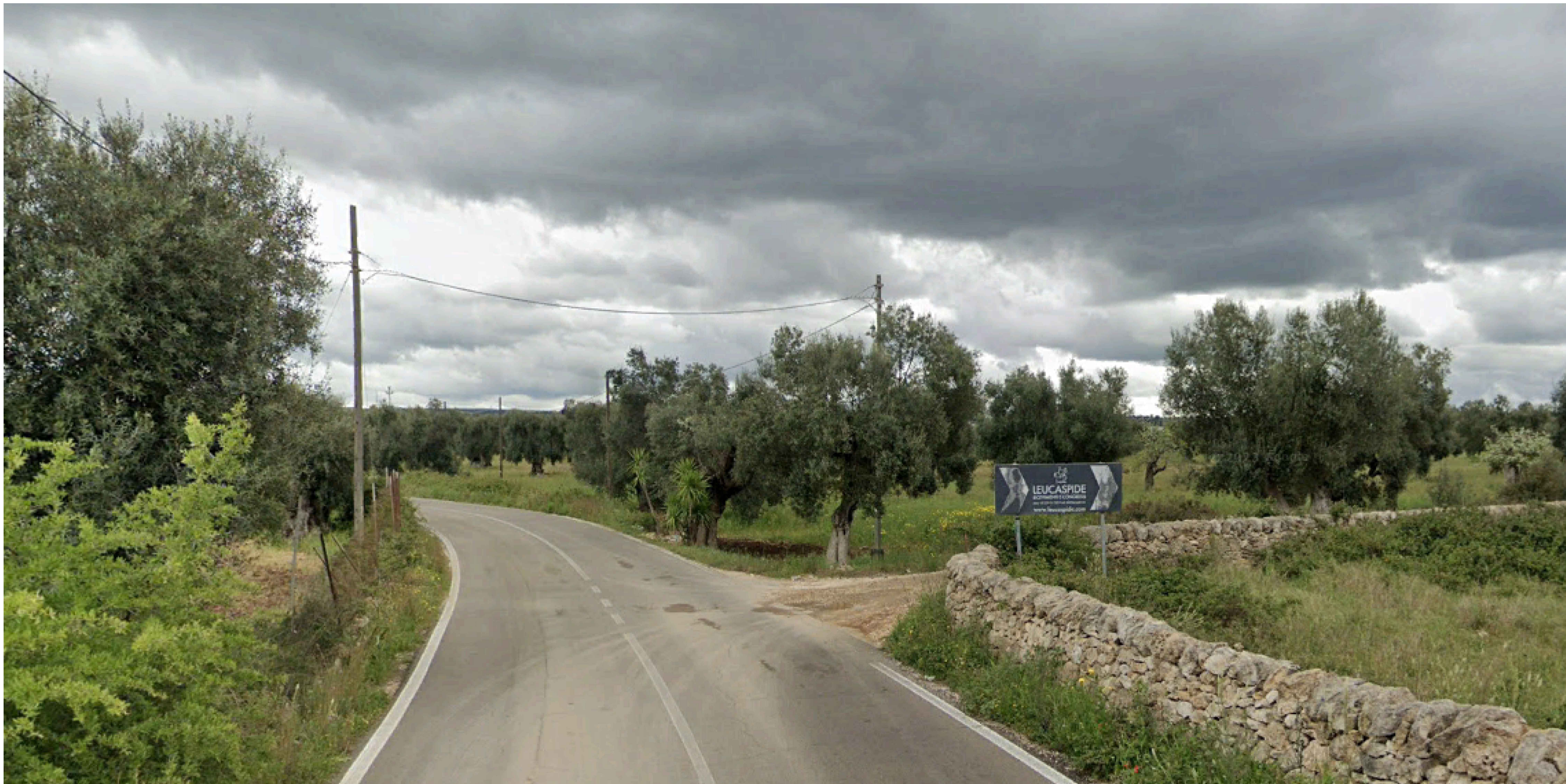
VIA SANTA CATERINA - SP 40 - FOTO 1