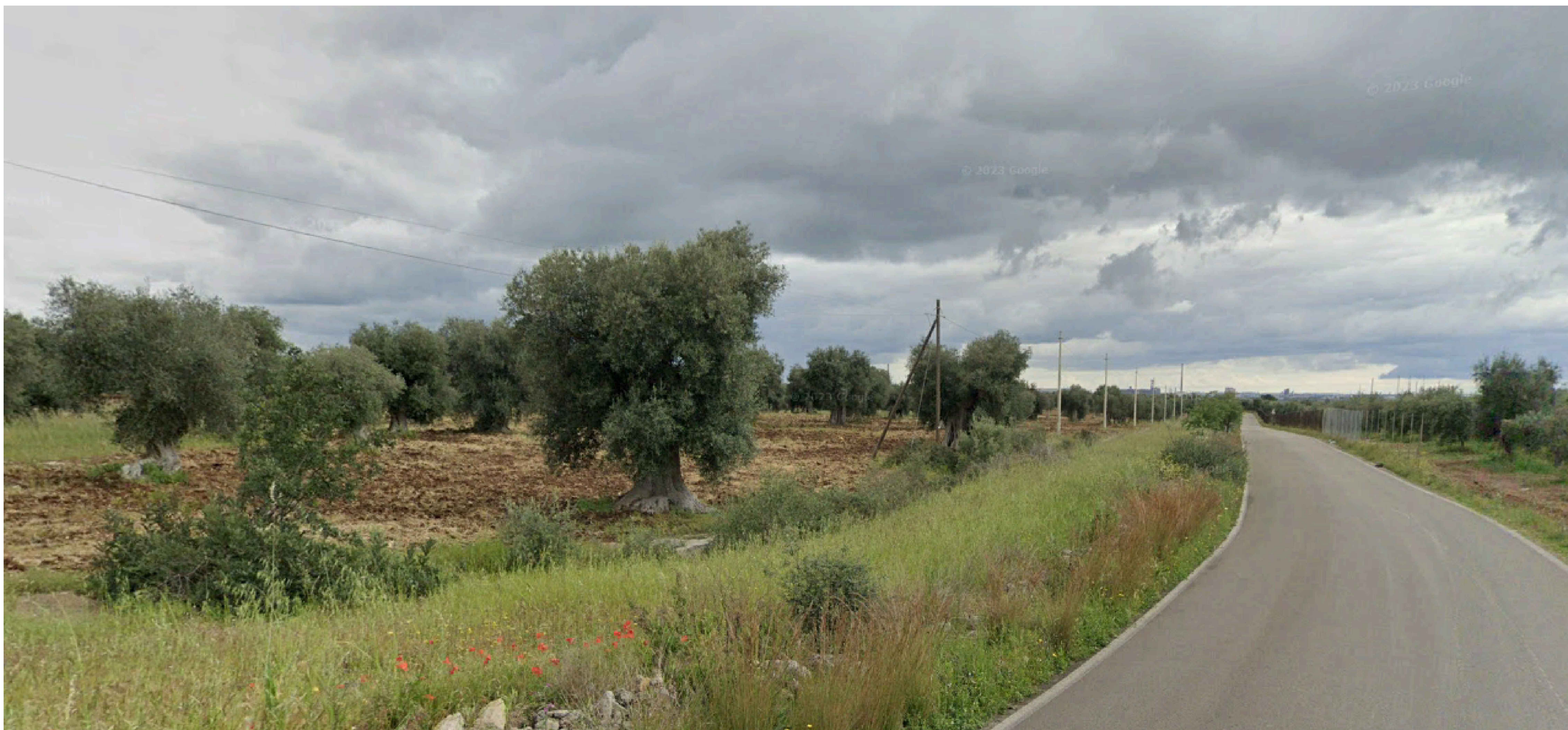
VIA SANTA CATERINA - SP 40 - FOTO 2