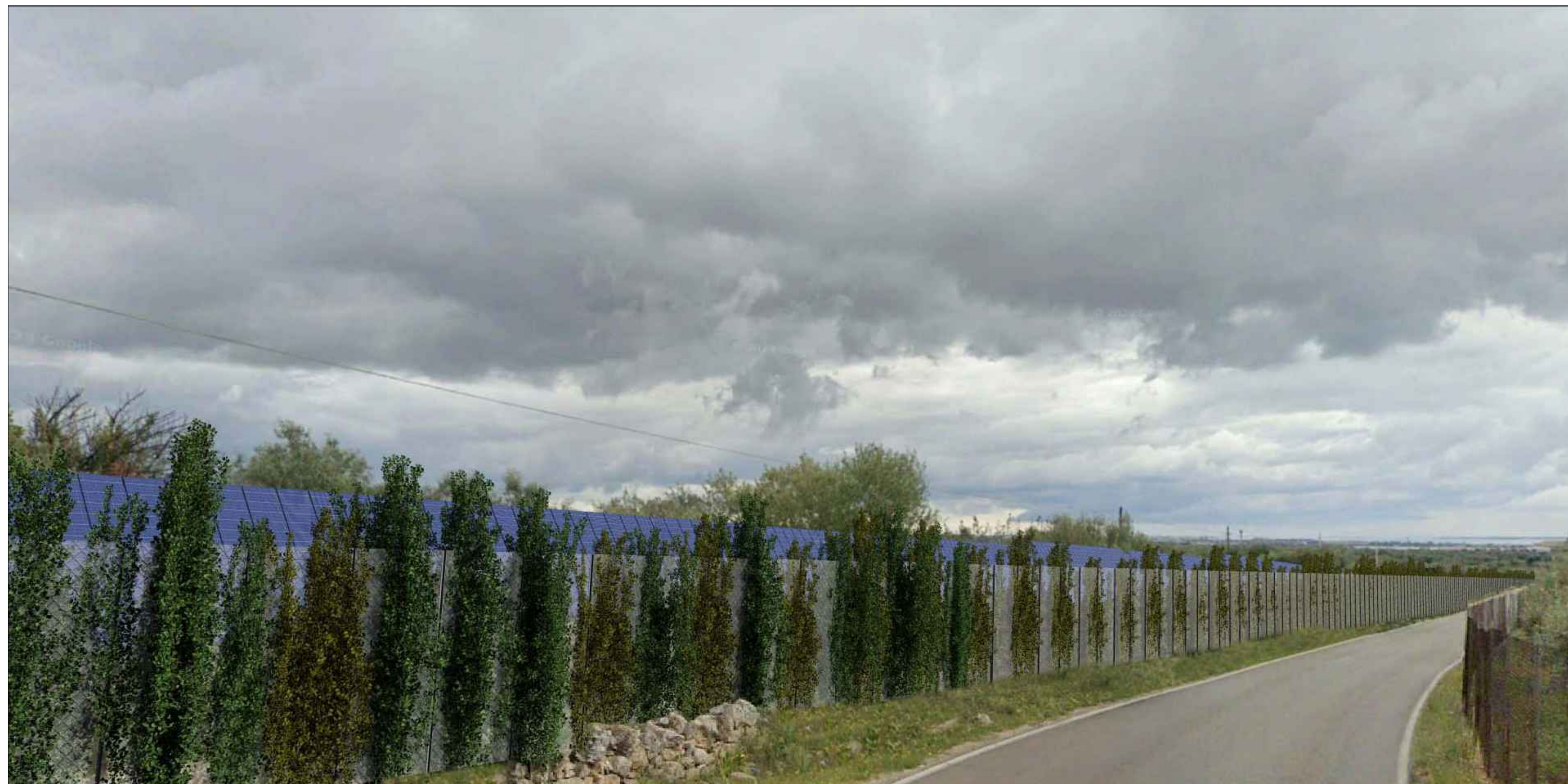
VIA SANTA CATERINA - SP 40 - FOTO 2