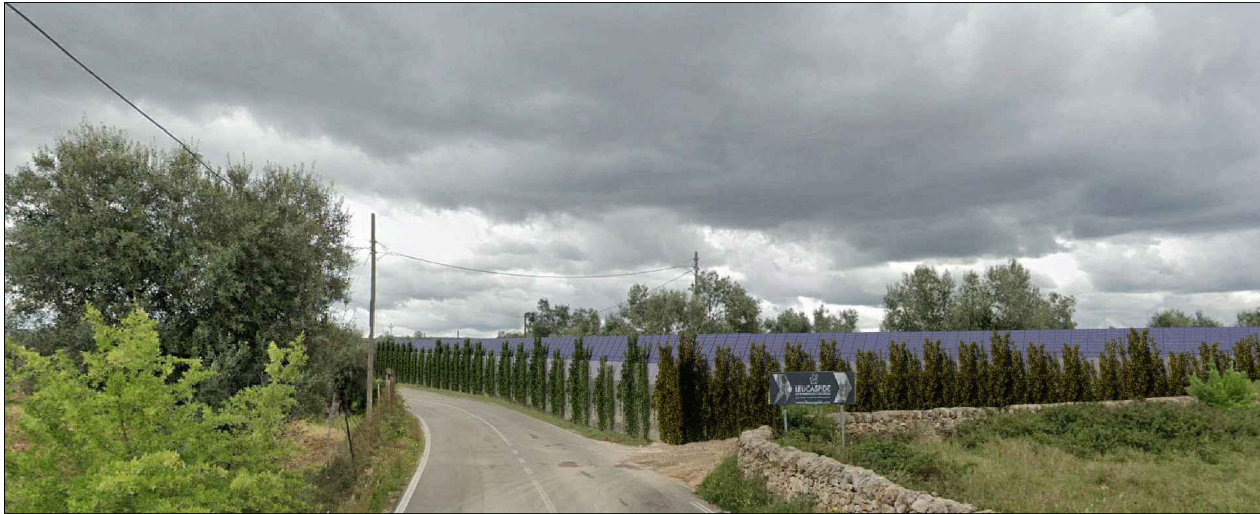
VIA SANTA CATERINA - SP 40 - FOTO 1