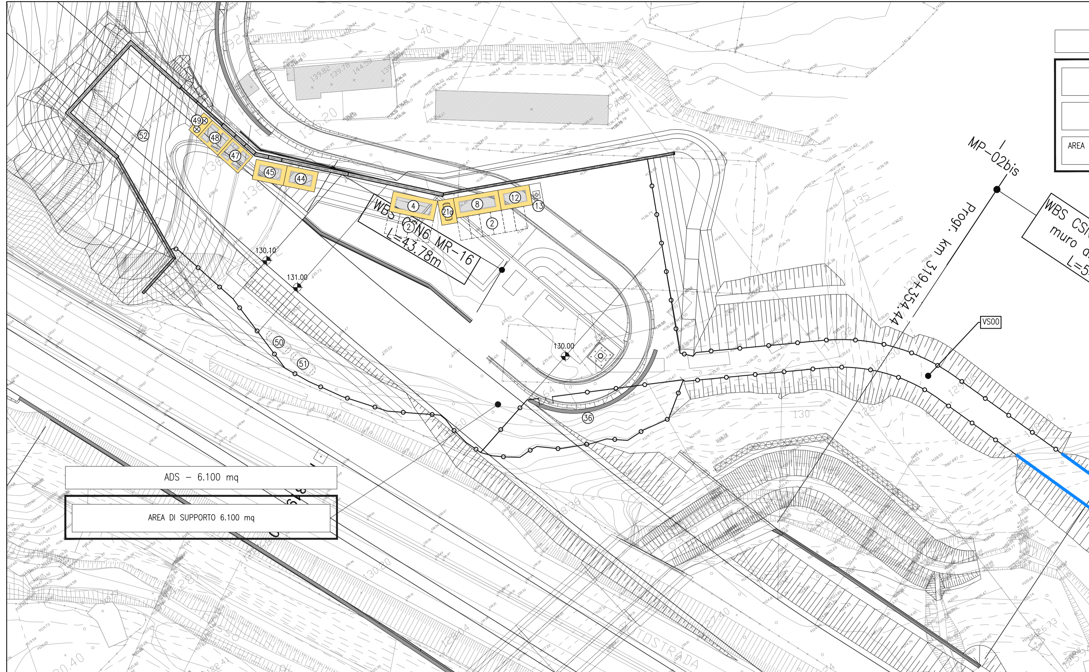
CO01 / ADS - CANTIERE OPERATIVO e AREA DI SUPPORTO PLANIMETRIA 1:500