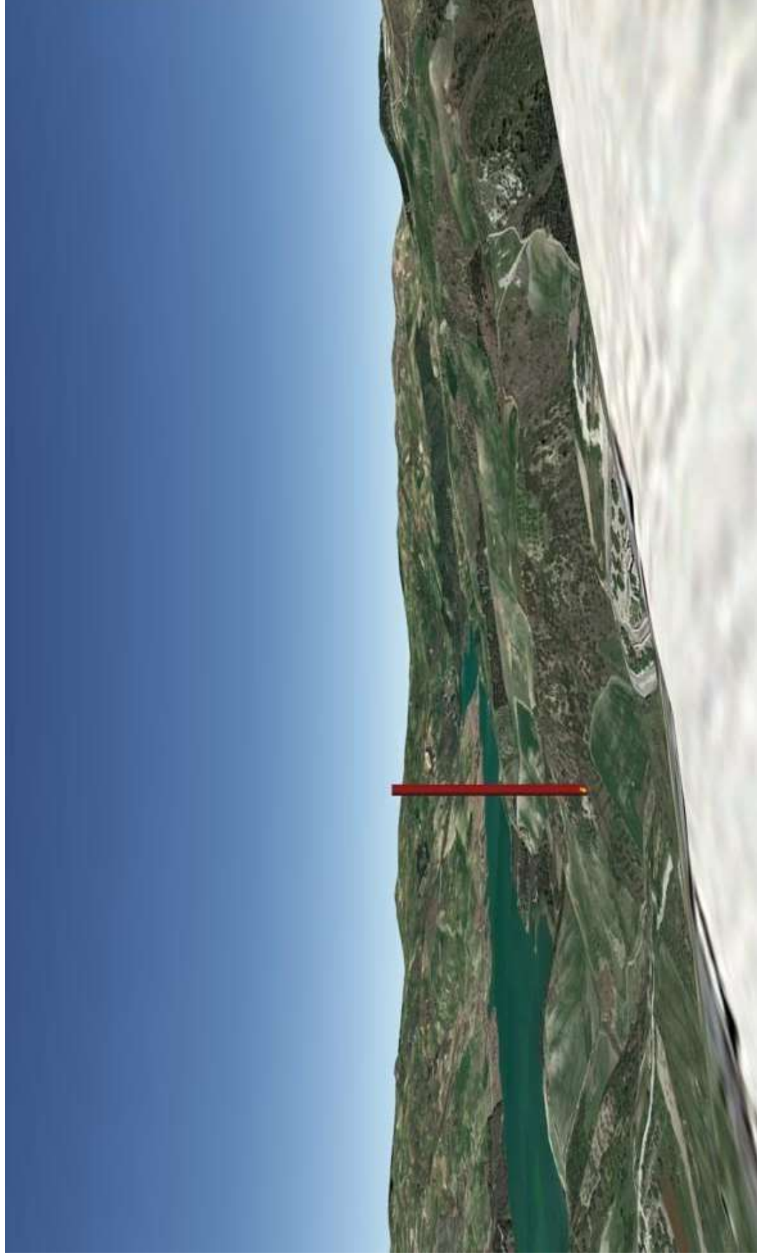
FIG. 2 – CELENZA VALFORTORE (VISTA VERSO NORD-NORD-OVEST DAL BELVEDERE CERULLI ALLE LOCALITA' LAGO DI OCCHITO – CAMARDA – MASSERIA DE COSMO).