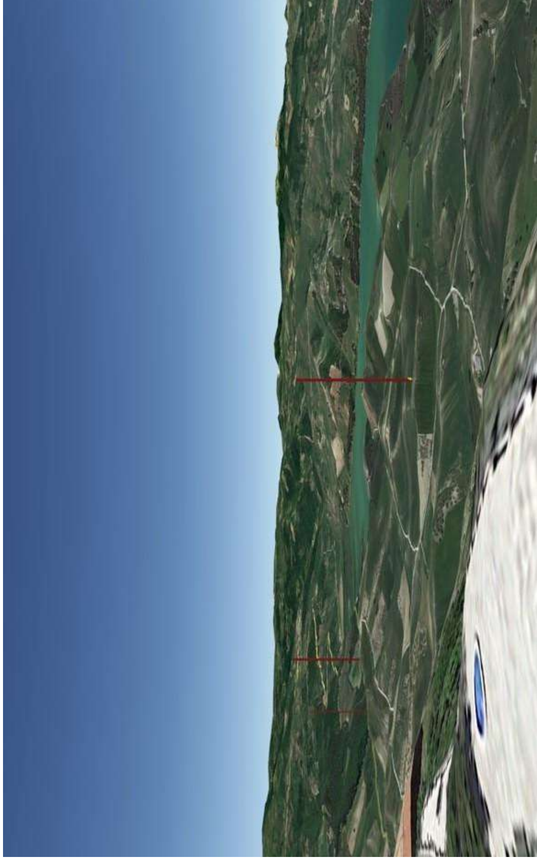
FIG. 5 – CELENZA VALFORTORE (VISTA VERSO SUD DAL BELVEDERE CERULLI ALLE LOCALITA' VIGNANUOVA – TOPPO CAPUANA).