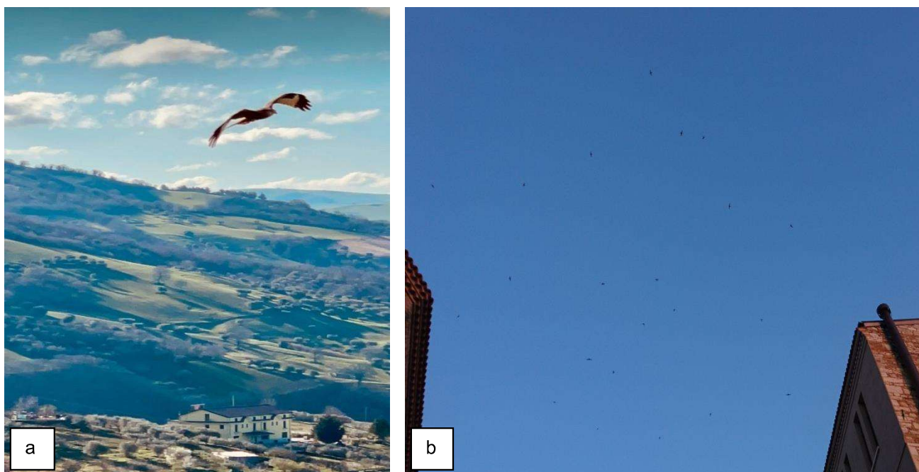
Figura 2 – a) Esemplare di Nibbio Reale ( Milvus Milvus ) sul vallone Cupa a Est del centro abitato; b) Rondoni comuni ( Apus Apus ) al di sopra del Monastero monumentale delle Clarisse.

Di seguito si riportano alcune foto dell'avifauna ritratta in prossimità del centro abitato di Celenza Valfortore, parte dell'areale in cui i volatili sono stanziali e migratori.