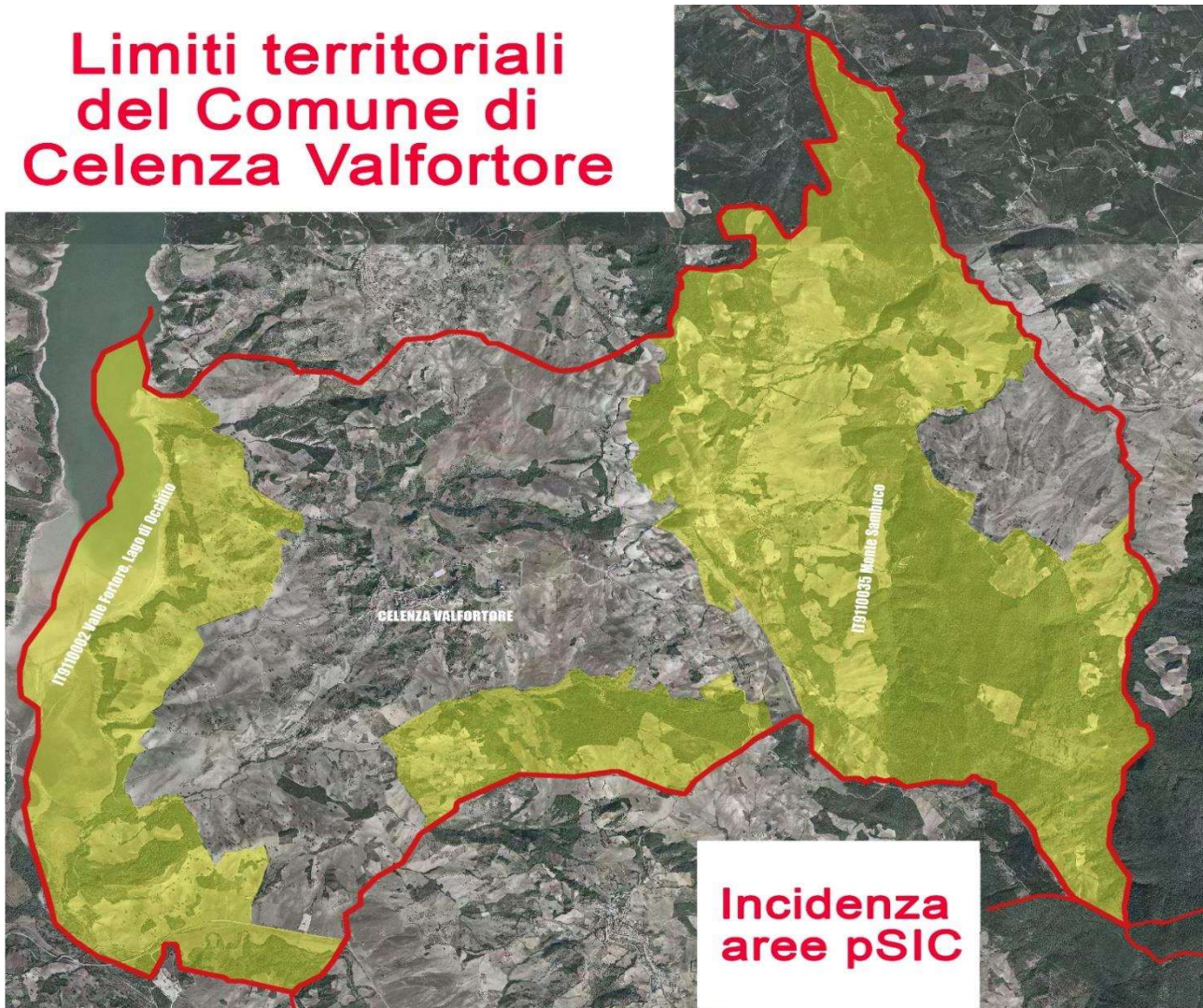
Figura 1 – Area demaniale del Comune di Celenza Valfortore (in rosso) con evidenziate le campiture delle aree (Siti di Interesse Comunitario, pSIC) e frappeste aree tampone.

La figura 1, evidenzia le parti del territorio definite come Sito di Interesse Comunitario (SIC) e frappeste Aree Tampone.