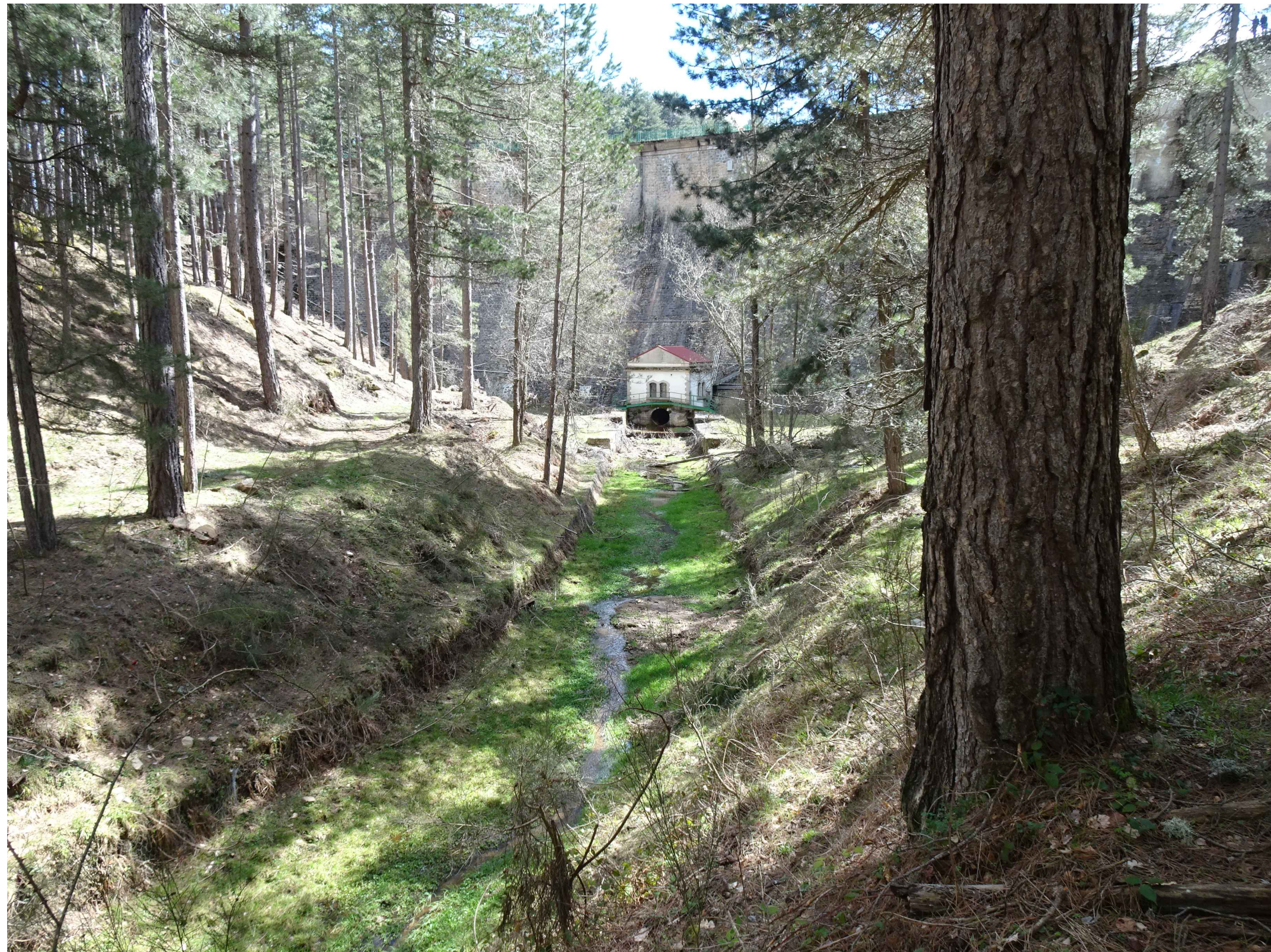
Punto di vista B Stato di fatto: paramento di valle della diga di Trepidò, camera di manovra valvola a farfalla e sbocco in alveo dello scarico di fondo