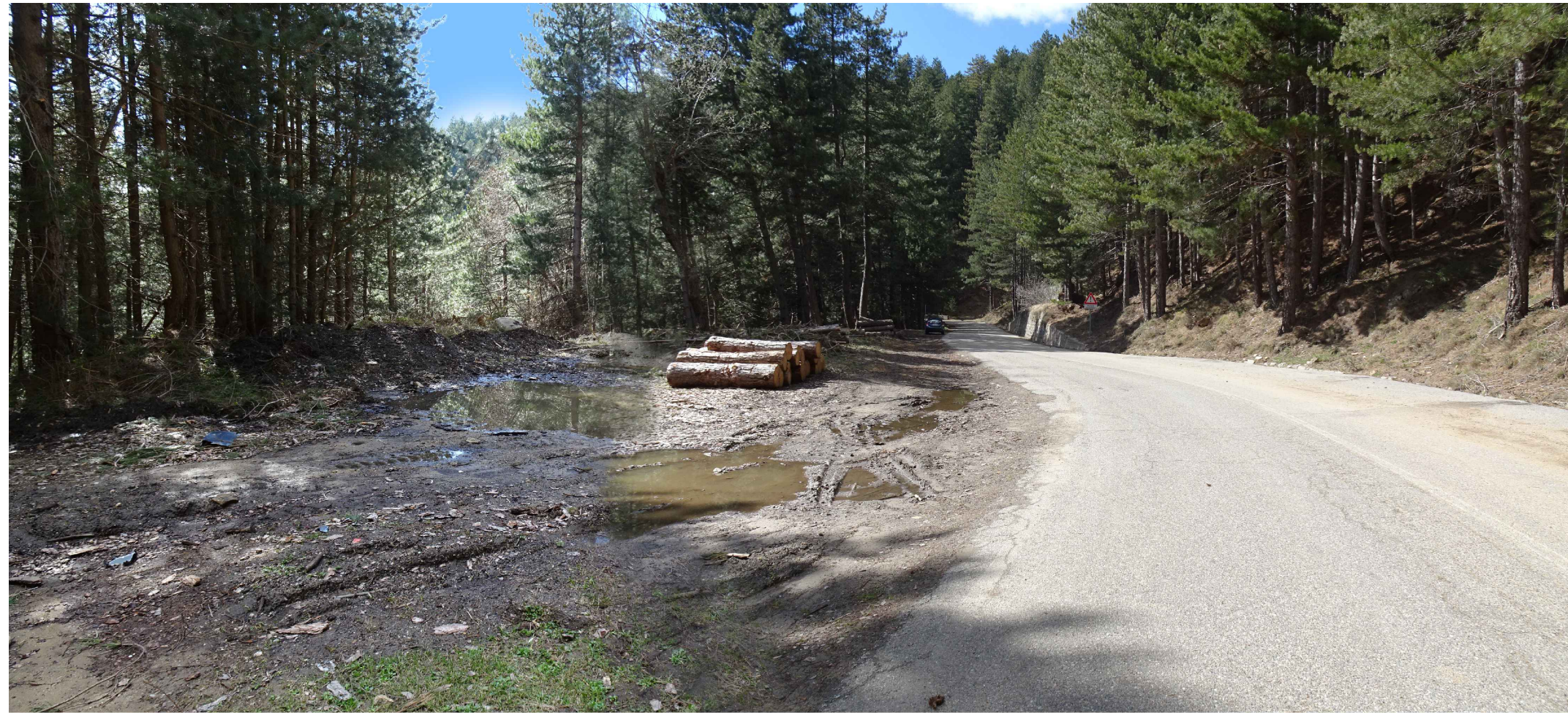
Punto di vista A Stato di fatto: punto di raccordo con la SP35 della strada di accesso al rilevato in progetto