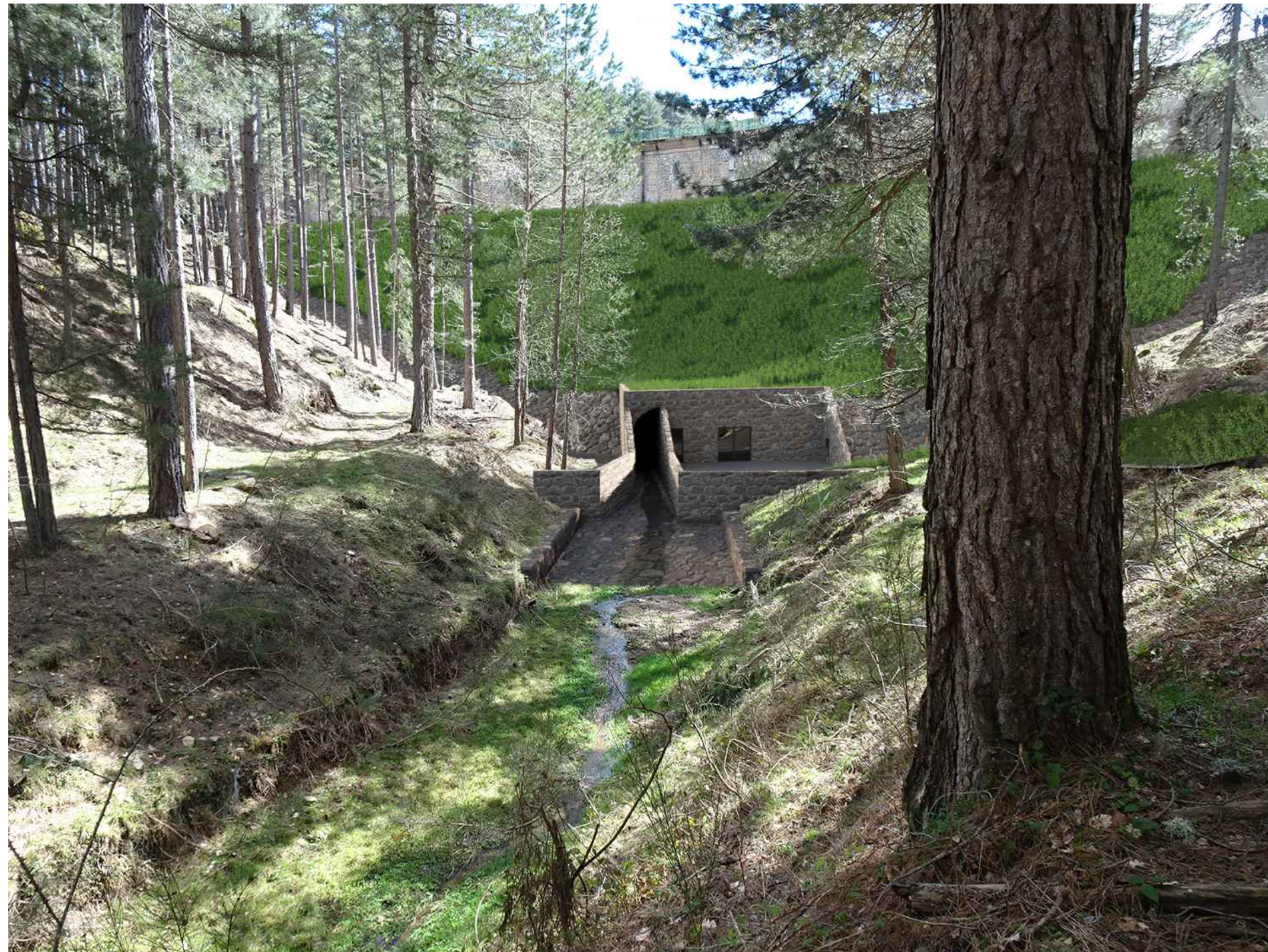
Punto di vista B Foto-simulazione: nuovo rilevato in materiali sciolti con copertura in terreno vegetato e pietrame al piede, nuova cabina di comando delle paratoie dello scarico di fondo, uscita dello scarico di fondo e fondo alveo in pietrame