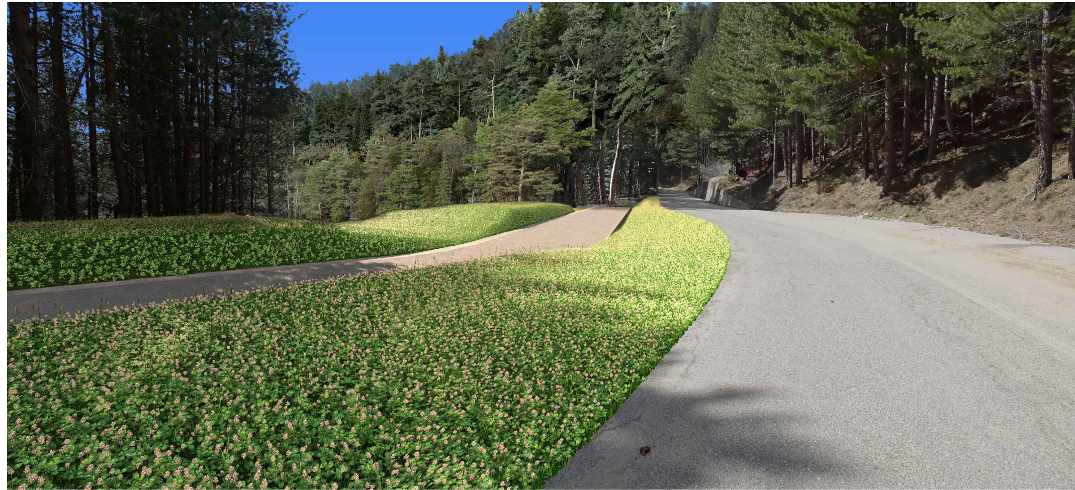
Punto di vista A Foto-simulazione: punto di raccordo con la SP35 della strada di accesso al rilevato in progetto