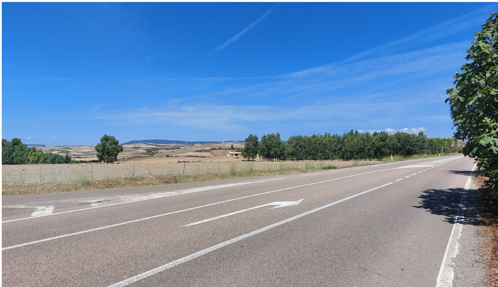
VISTA 10 - ANTE OPERAM