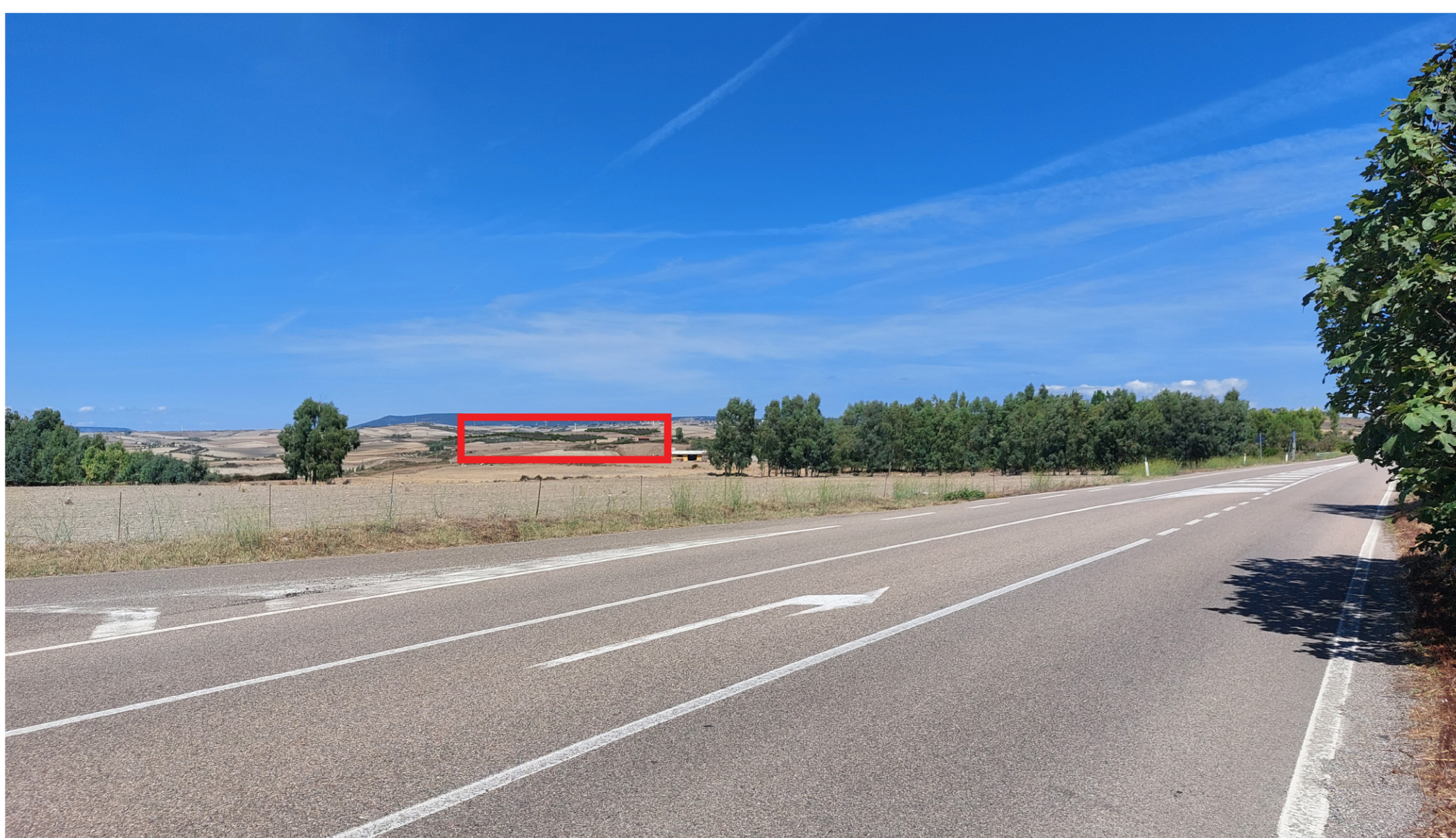
VISTA 10 - POST OPERAM (CON MITIGAZIONE)