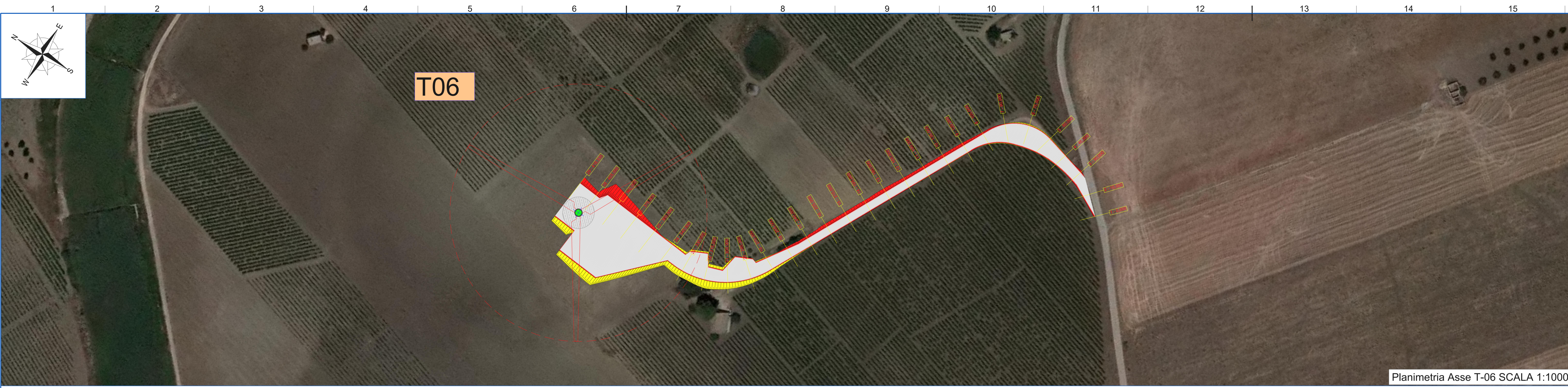
Planimetria Asse T-06 SCALA 1:1000