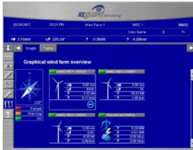
Figura 2 SCADA – Visualizzazione Stato del Parco Eolico.