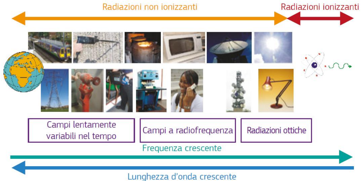
Grafico esplicativo della suddivisione delle radiazioni in non ionizzanti e ionizzanti

Si consulti in proposito l'immagine appresso indicata: