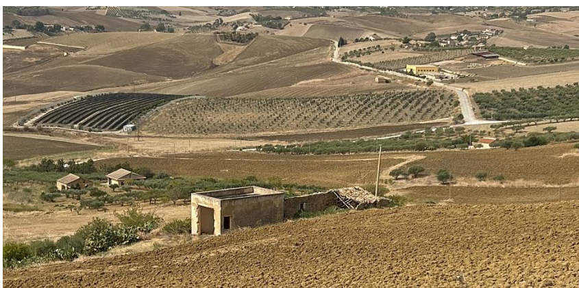
Figura 3 - Rappresentazione del fabbricato NR20.