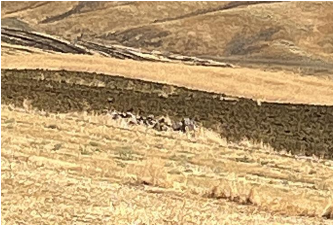
Figura 7 - Raffigurazione del fabbricato NR95.