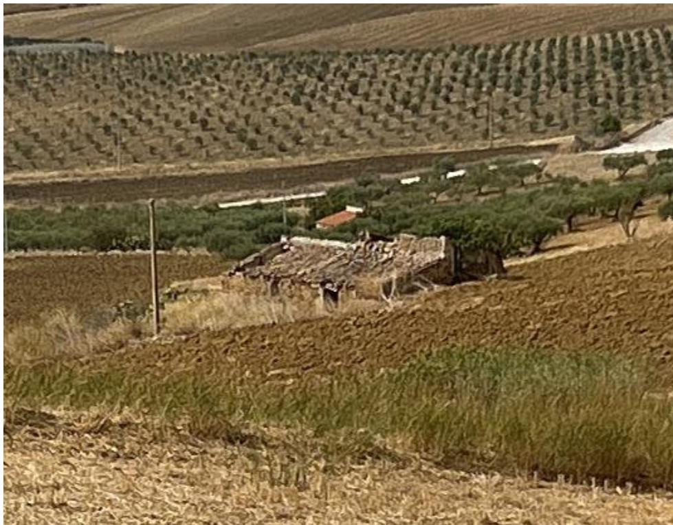
Figura 5 - Rappresentazione del fabbricato NR37.