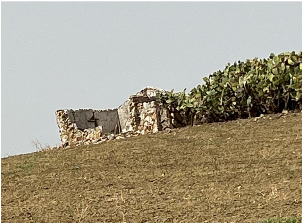
Figura 9 - Raffigurazione del fabbricato NR82, NR87, NR101, NR102.