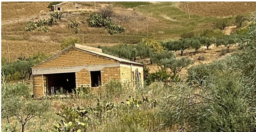
Figura 2 - Rappresentazione del fabbricato NR18.