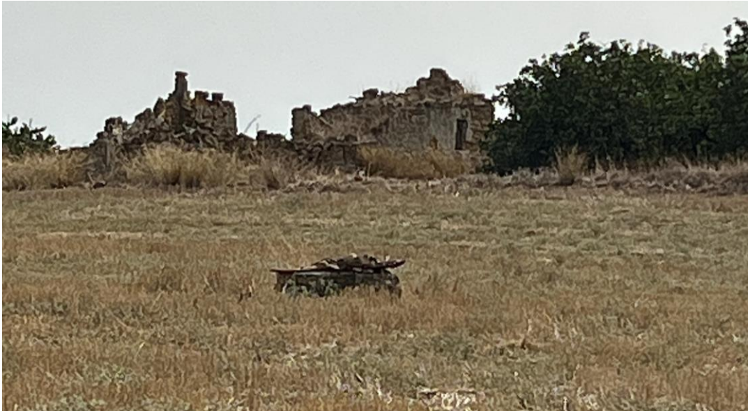
Figura 11- Rappresentazione del fabbricato NR110.