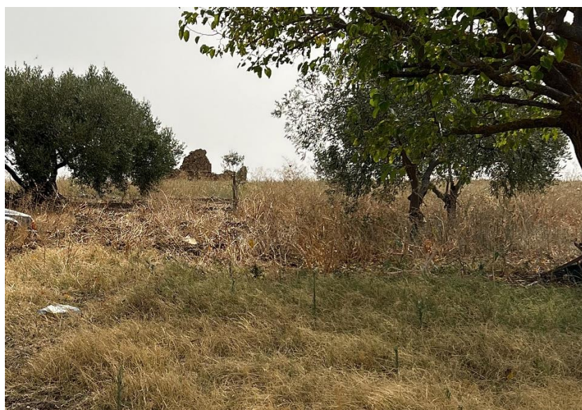
Figura 4 - Rappresentazione del fabbricato NR36.