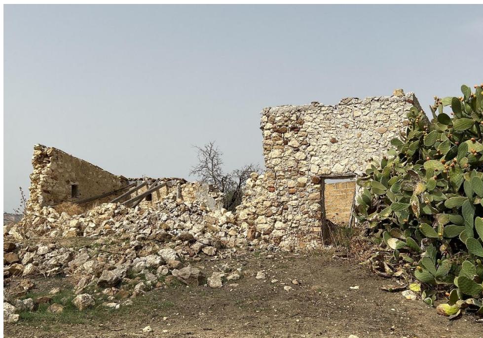
Figura 6 - Rappresentazione del fabbricato NR81.