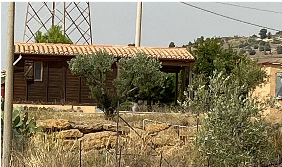
Figura 8 - Raffigurazione del fabbricato NR96.