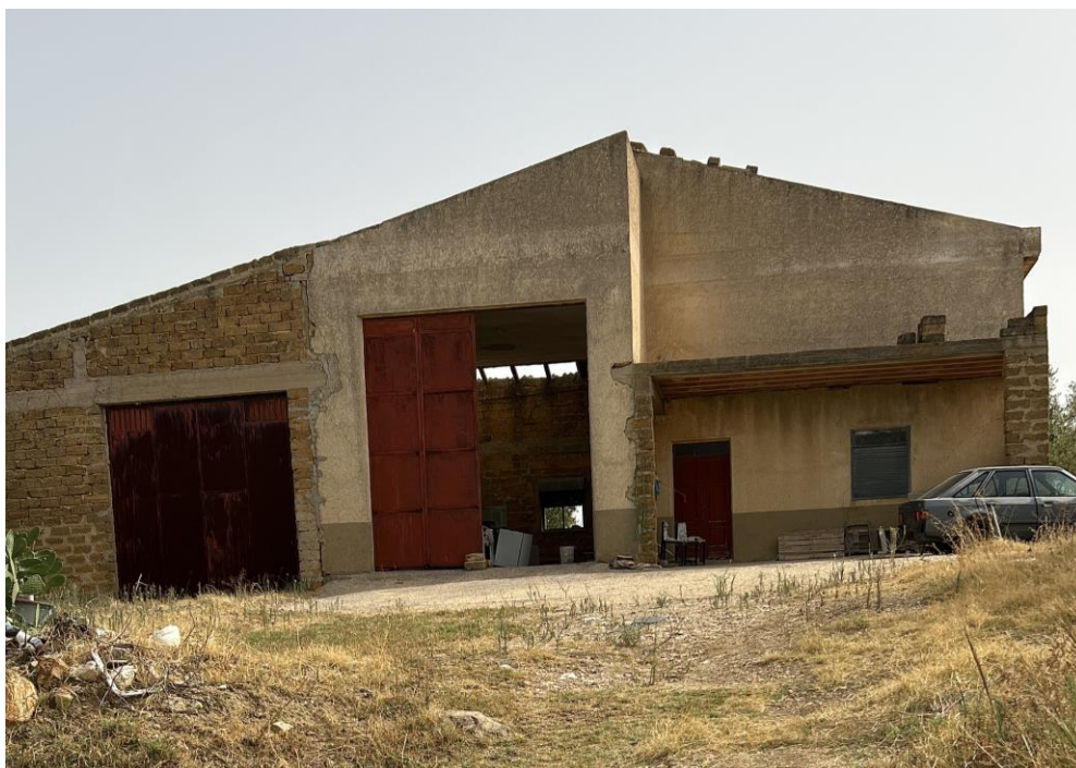
Figura 10 - Raffigurazione del fabbricato NR108.