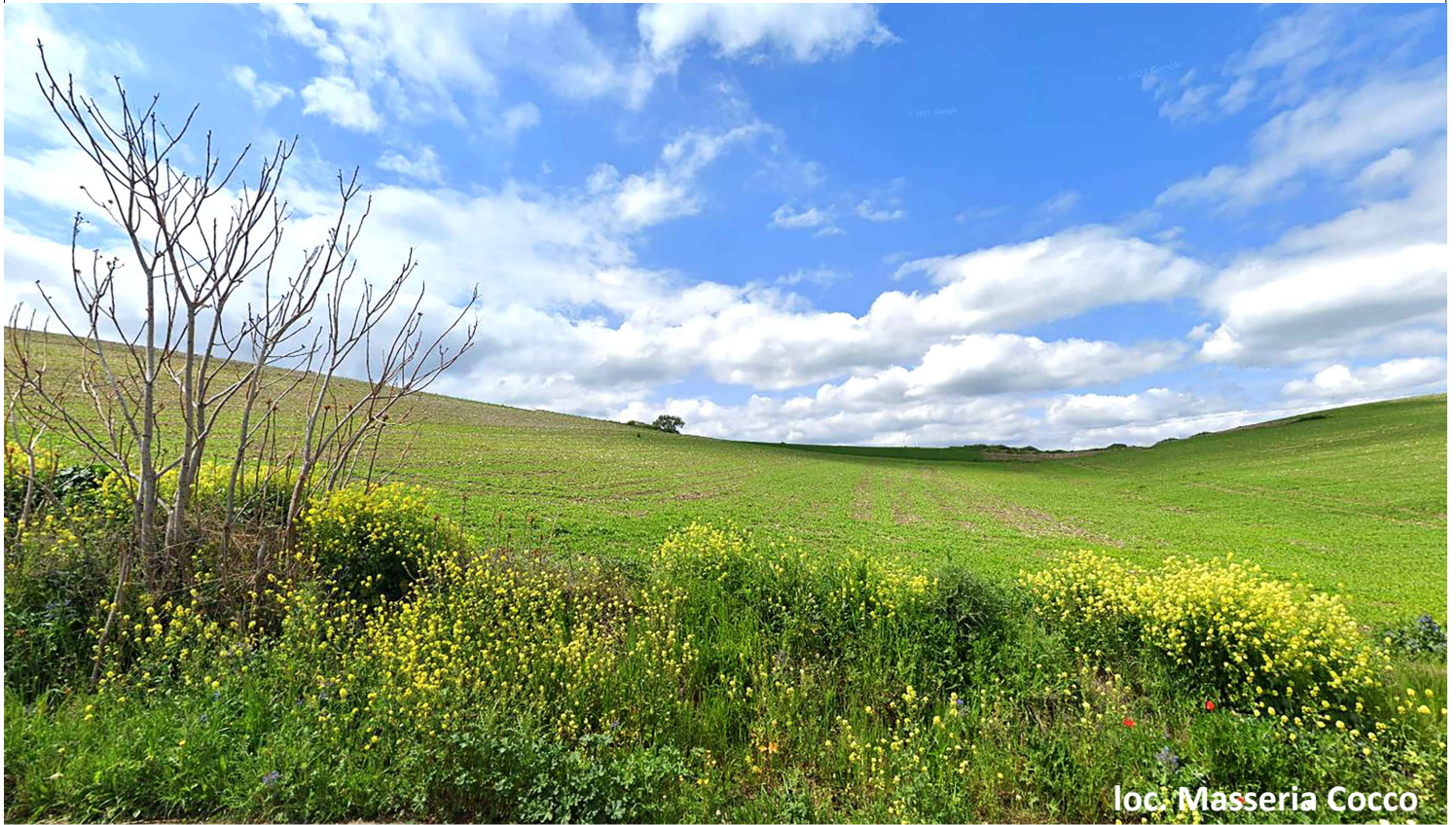
loc. Masseria Cocco