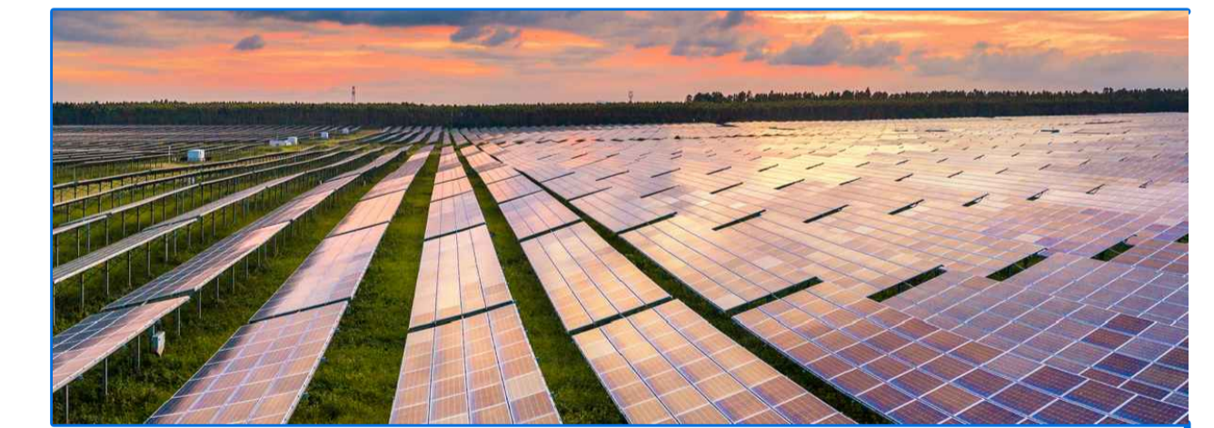
Impianto Di Produzione Di Energia da Fonte Solare Fotovoltaica Denominato "New Sun 1"