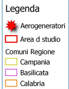
Carta delle rotte migratorie (Piano faunistico-venatorio)