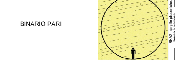
INTERFERENZE COPERTURE (m)