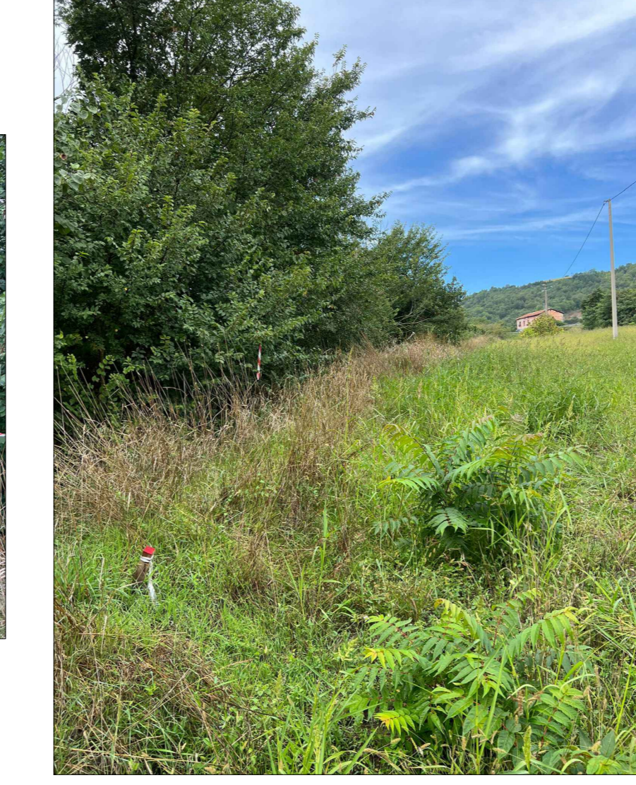
Vista panoramica aree di imbocco scattata in prossimità della galleria esistente (SS90 p.k. ≈ 49+150)