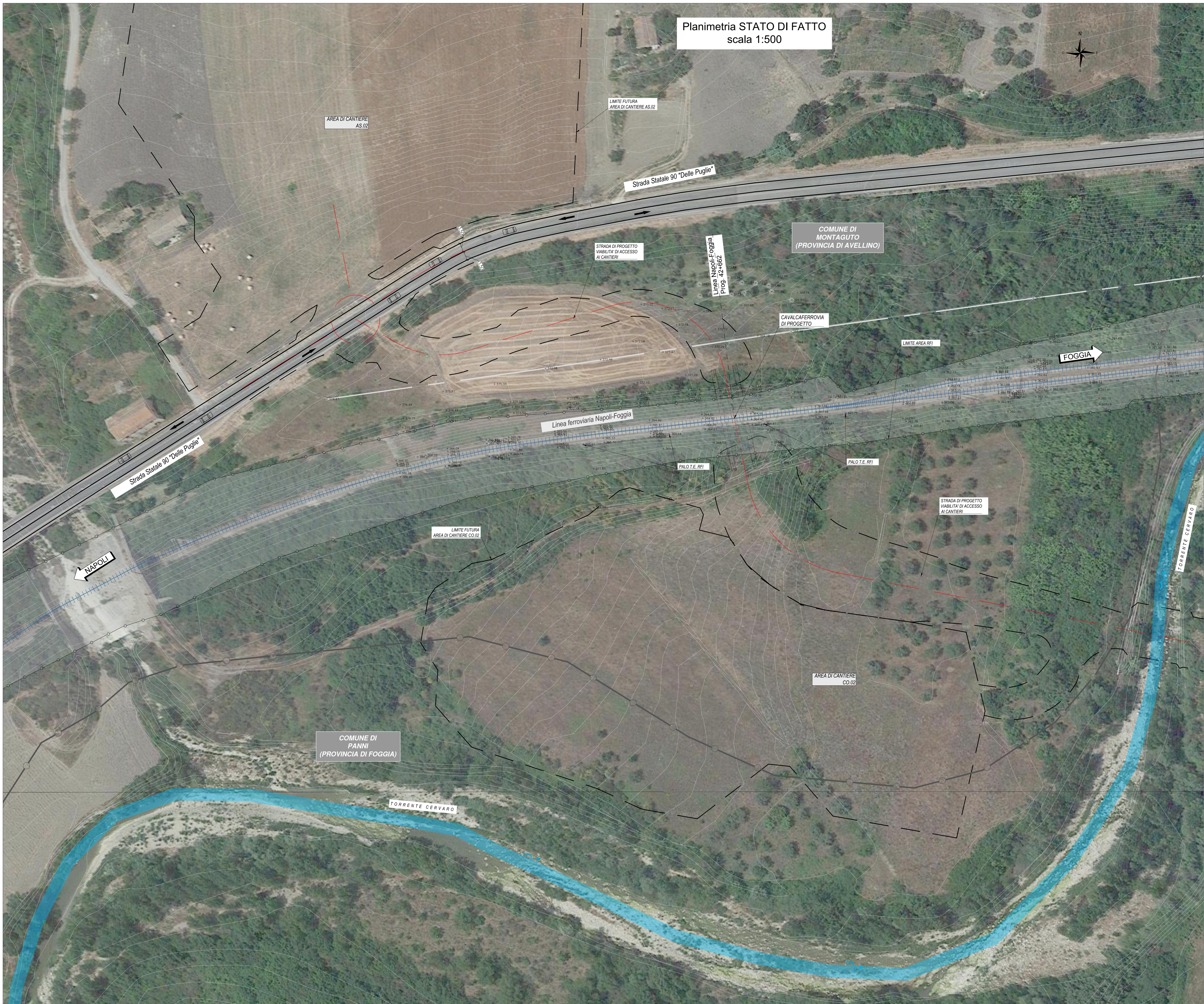
Planimetria STATO DI FATTO scala 1:500