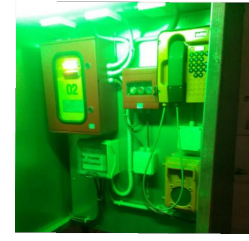
IMPIANTO TELEFONICO FISSO E MOBILE