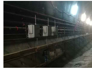
IMPIANTO MONITORAGGIO GAS E ANTINCENDIO