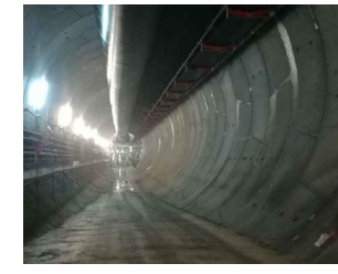
IMPIANTO ILLUMINAZIONE EMERGENZA