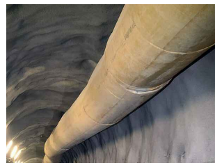
IMPIANTO DI VENTILAZIONE