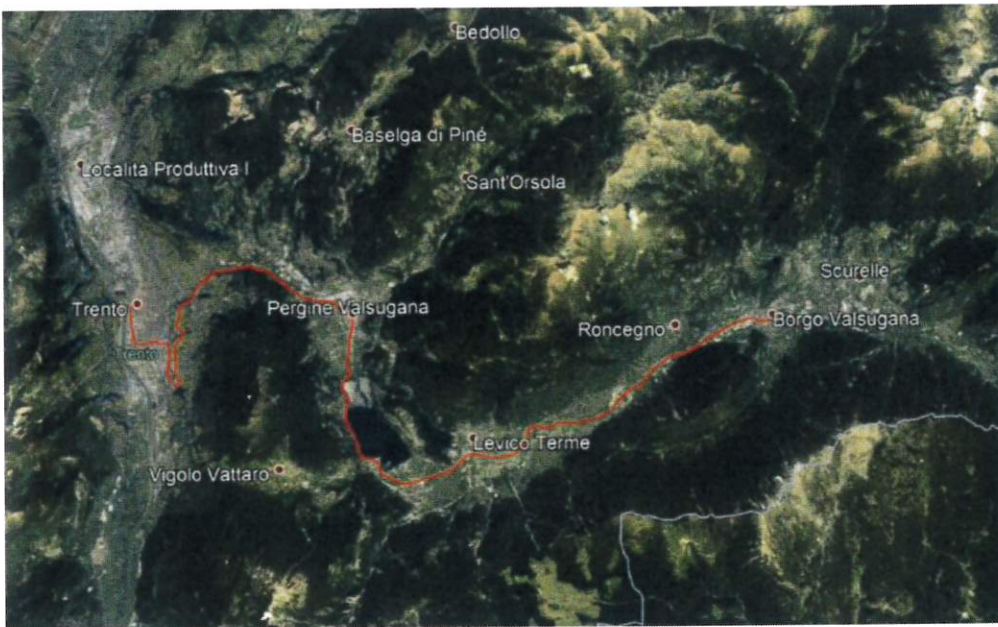
Lotto 1 – oggetto della presente VIA- Trento-Borgo Valsugana Est

Nello specifico gli interventi relativi al Lotto 1 prevedono quanto segue: