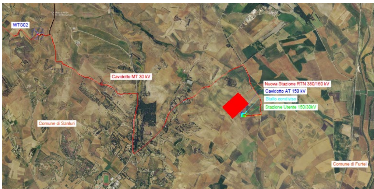
Figura 3-2 – Inquadramento generale da ortofoto – opere di connessione

La centrale di produzione, anche detta “parco eolico”, è costituita da n.5 aerogeneratori della potenza unitaria pari a 7,2 MW, interconnessi da una rete interrata di cavi MT 30 kV (in fase di realizzazione tale tensione di distribuzione potrebbe essere aumentata fino ad un massimo di 36 kV, in funzione di aspetti successivi inerenti eventuali opportunità legate alla connessione). Le opere di connessione, invece, prevedono la costruzione di una stazione elettrica di trasformazione MT/AT, anche detta “stazione utente”, di proprietà del soggetto produttore e delle infrastrutture brevemente descritte di seguito.