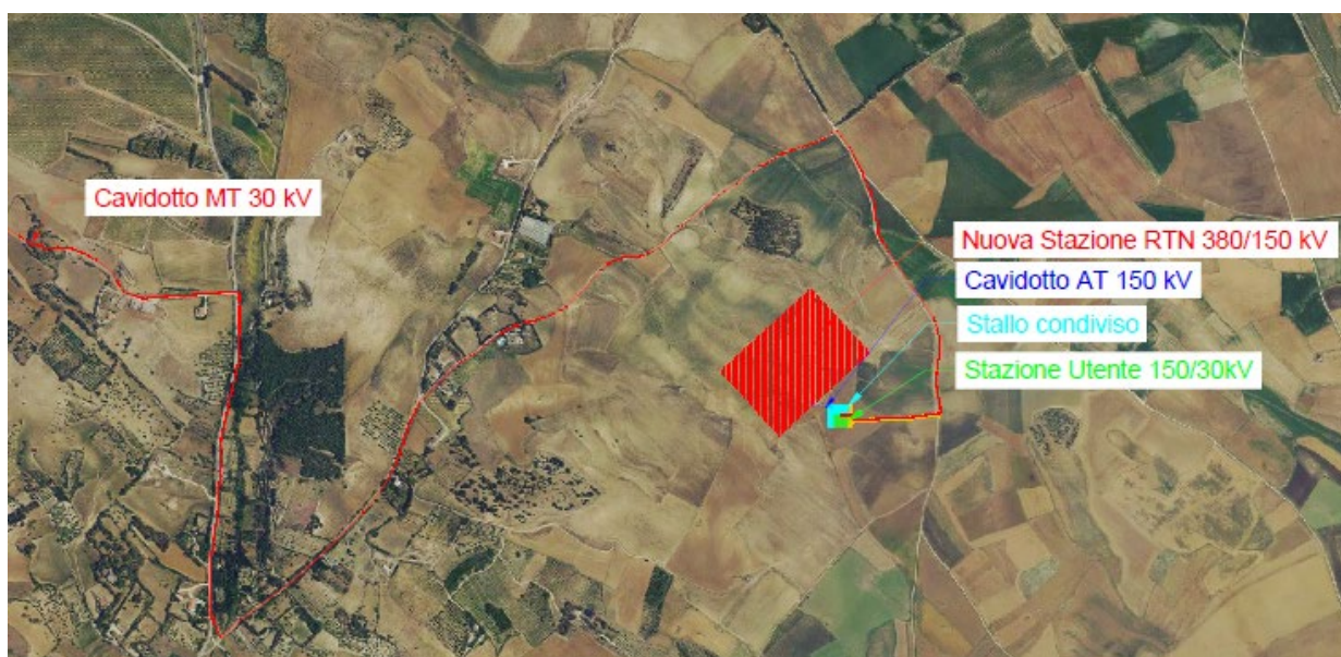
Figura 3-3 – Ubicazione opere di connessione su ortofoto

Di seguito viene illustrato il layout delle opere di connessione e delle opere di rete.