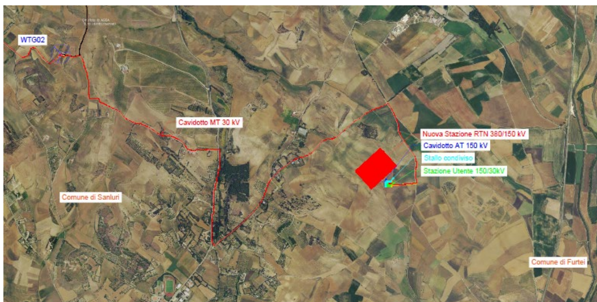
Figura 3-2 – Inquadramento generale da ortofoto – opere di connessione

La centrale di produzione, anche detta “parco eolico”, è costituita da n.5 aerogeneratori della potenza unitaria pari a 7,2 MW, interconnessi da una rete interrata di cavi MT 30 kV (in fase di realizzazione tale tensione di distribuzione potrebbe essere aumentata fino ad un massimo di 36 kV, in funzione di aspetti successivi inerenti eventuali opportunità legate alla connessione). Le opere di connessione, invece, prevedono la costruzione di una stazione elettrica di trasformazione MT/AT, anche detta “stazione utente”, di proprietà del soggetto produttore e delle infrastrutture brevemente descritte di seguito.