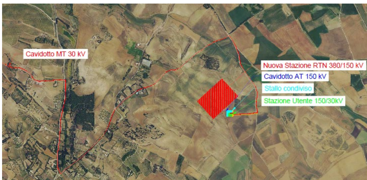
Figura 3-3 – Ubicazione opere di connessione su ortofoto

Di seguito viene illustrato il layout delle opere di connessione e delle opere di rete.