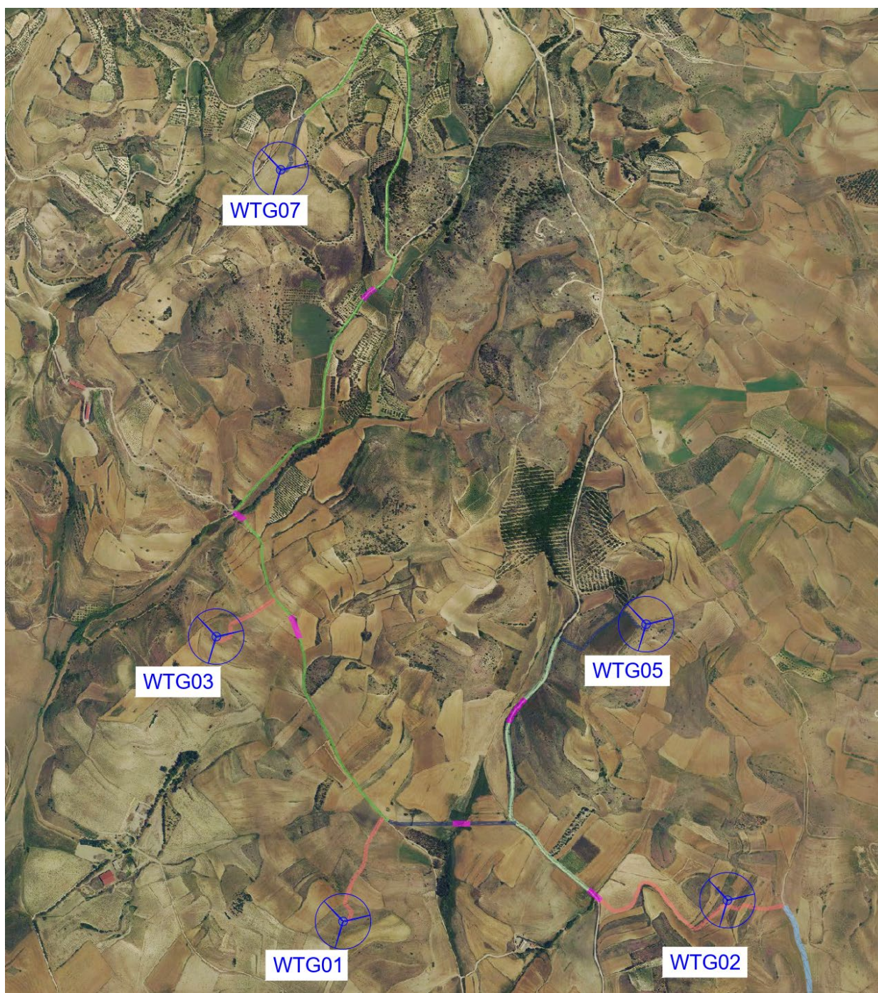
Figura 4-1 – Layout della rete MT su ortofoto - impianto eolico

In base ai tracciati delle reti MT come da progetto e come da figure seguenti vengono individuate, censite e descritte le interferenze, e, per ognuna di esse, viene fornita una soluzione tecnica di gestione dell’interferenza.