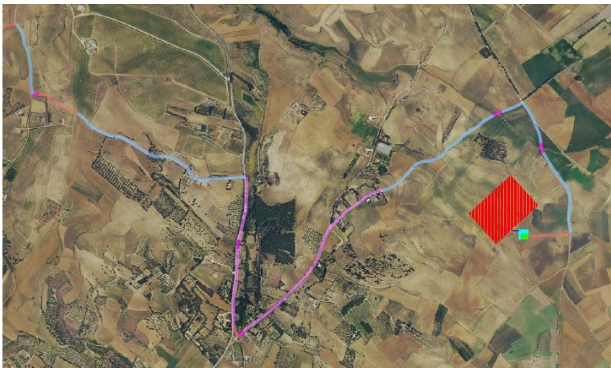
Figura 4-2 – Layout della rete MT su ortofoto – connessione alla SSE

Il percorso di dettaglio dei cavi delle dorsali è mostrato nella tavola “EOMRMD-I_Tav.23 - Planimetria del tracciato del cavidotto MT e sezioni tipo”.