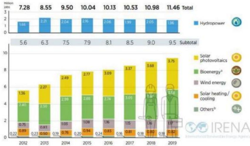
Dati occupazionali nel settore rinnovabile negli ultimi anni

Dal Rapporto emerge che sta cambiando lo scenario geografico del settore delle energie pulite con una diversificazione della filiera: se fino a poco tempo fa le industrie delle energie rinnovabili erano concentrate in pochi mercati importanti, come la Cina, gli Stati Uniti e Paesi come la Malesia, la Thailandia e il Vietnam sono stati responsabili di una maggiore percentuale di crescita dell'occupazione nel settore delle rinnovabili nel 2019, il che ha permesso all'asia di raggiungere una quota del 62 % di posti di lavoro nelle energie green in tutto il mondo (solo in Cina il 39%).