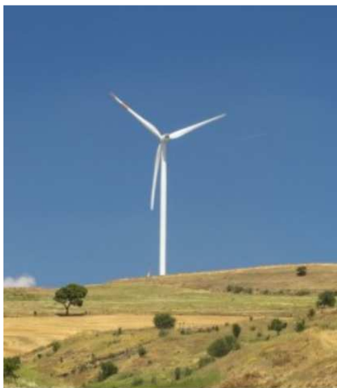
Progetto parco eolico "Cantorato"