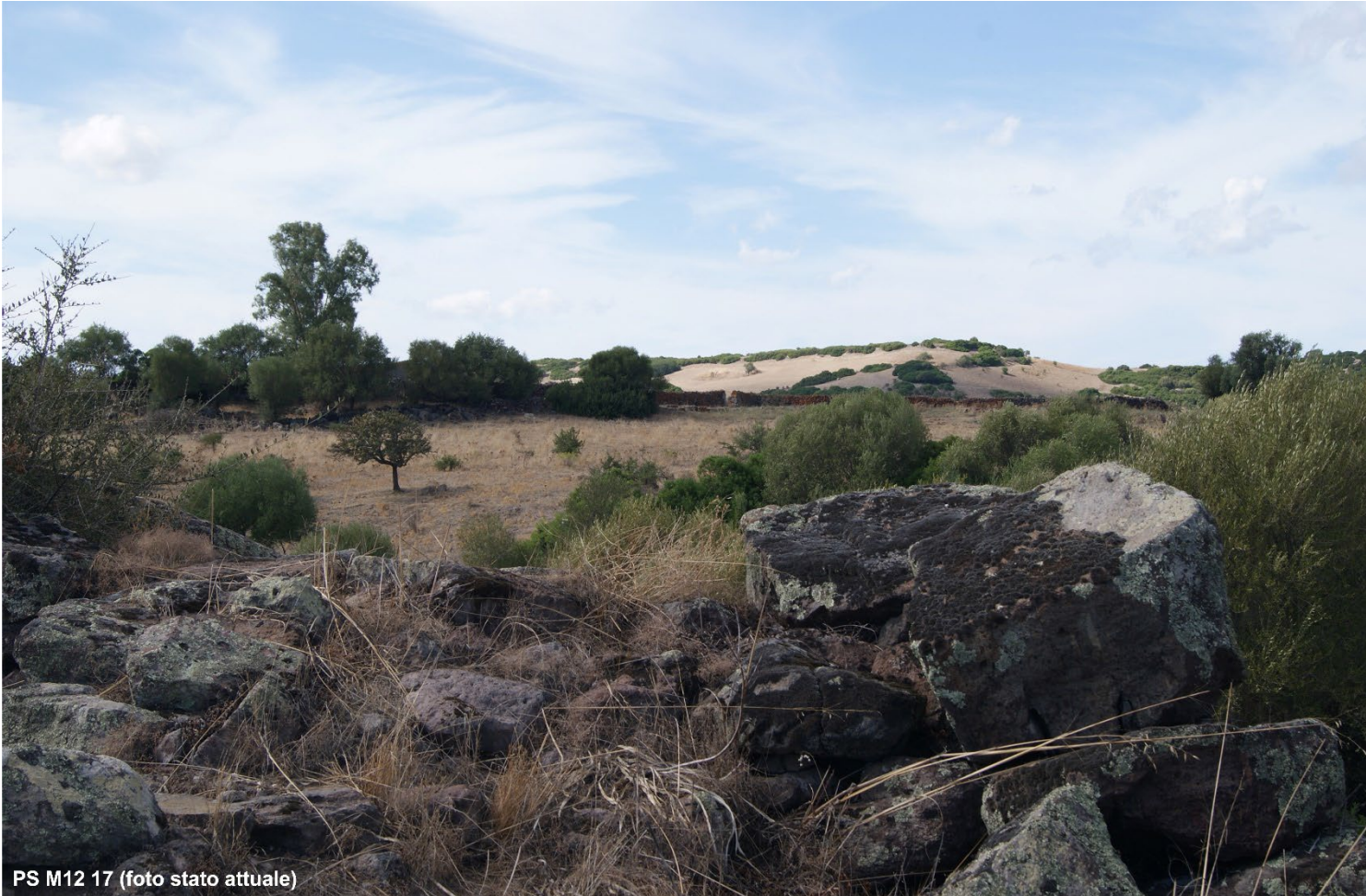
PS M12 17 (foto stato attuale)