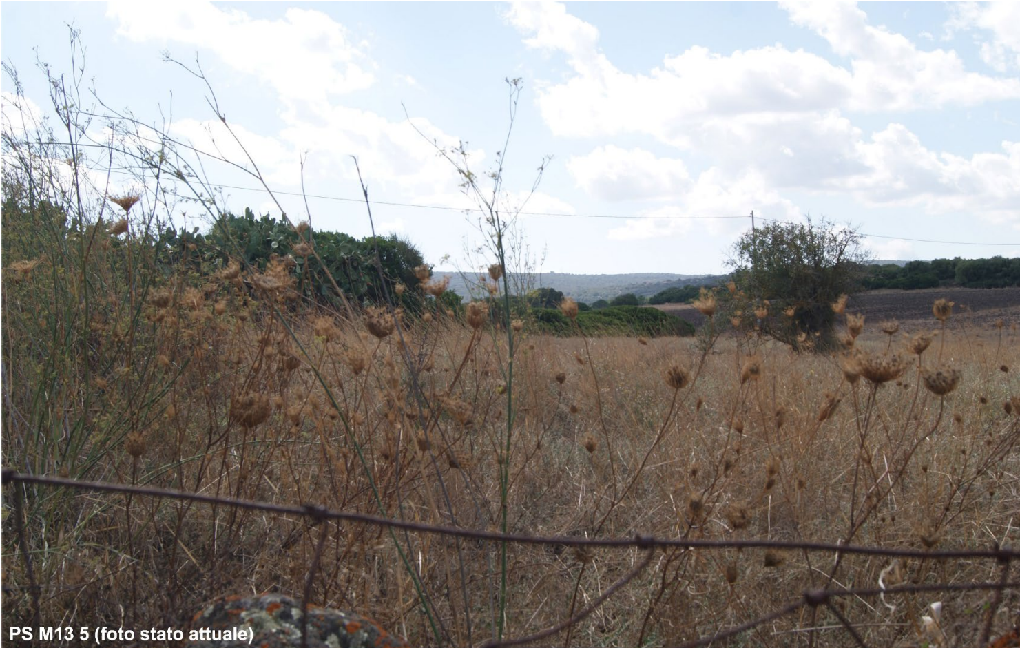
PS M13 5 (foto stato attuale)