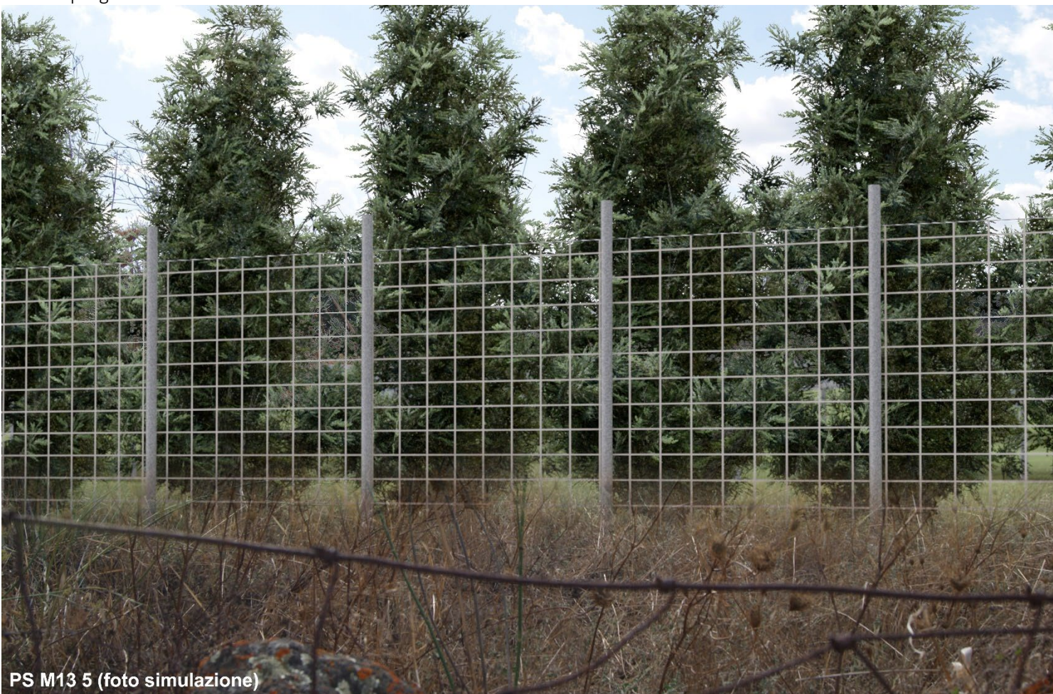
PS M13 5 (foto simulazione)