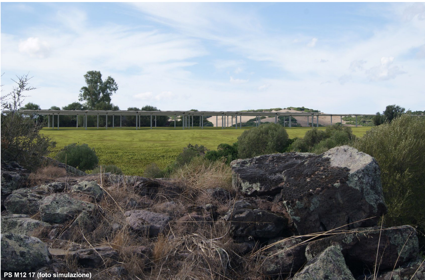
PS M12 17 (foto simulazione)