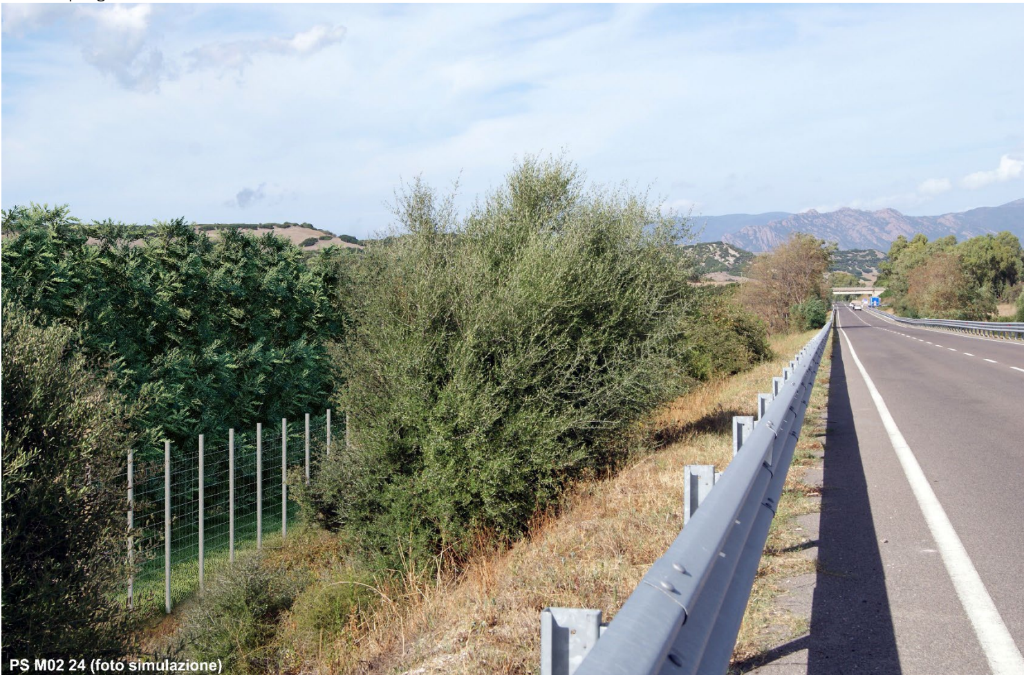
PS M02 24 (foto simulazione)