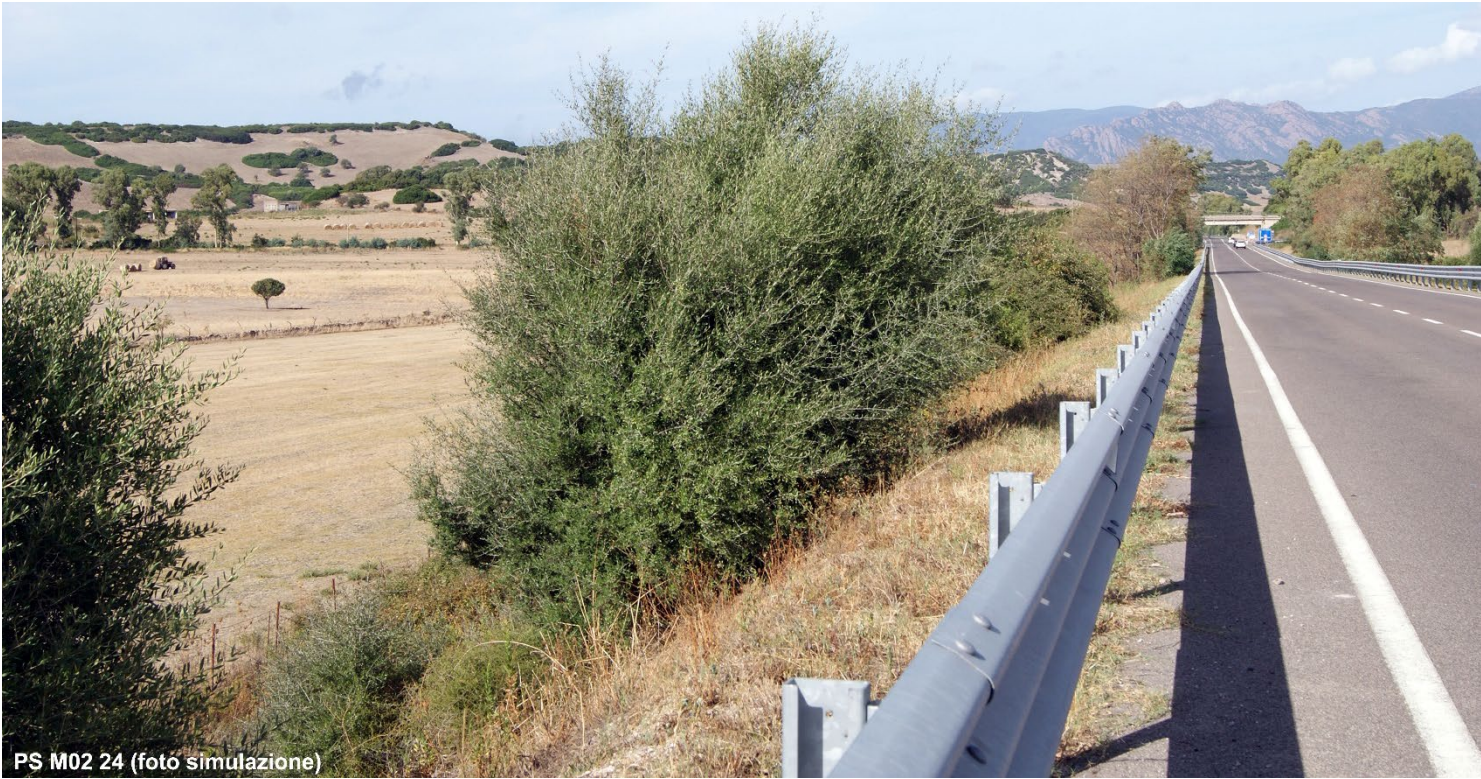
PS M02 24 (foto simulazione)

PS M02 24_VISTA - SS 672 SASSARI TEMPIO – Stato di fatto