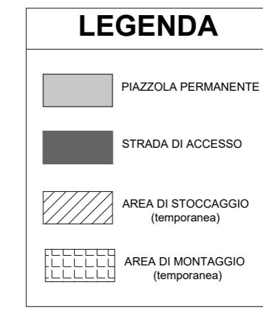
PIAZZOLA DI CANTIERE PIANTA SCHEMATICA