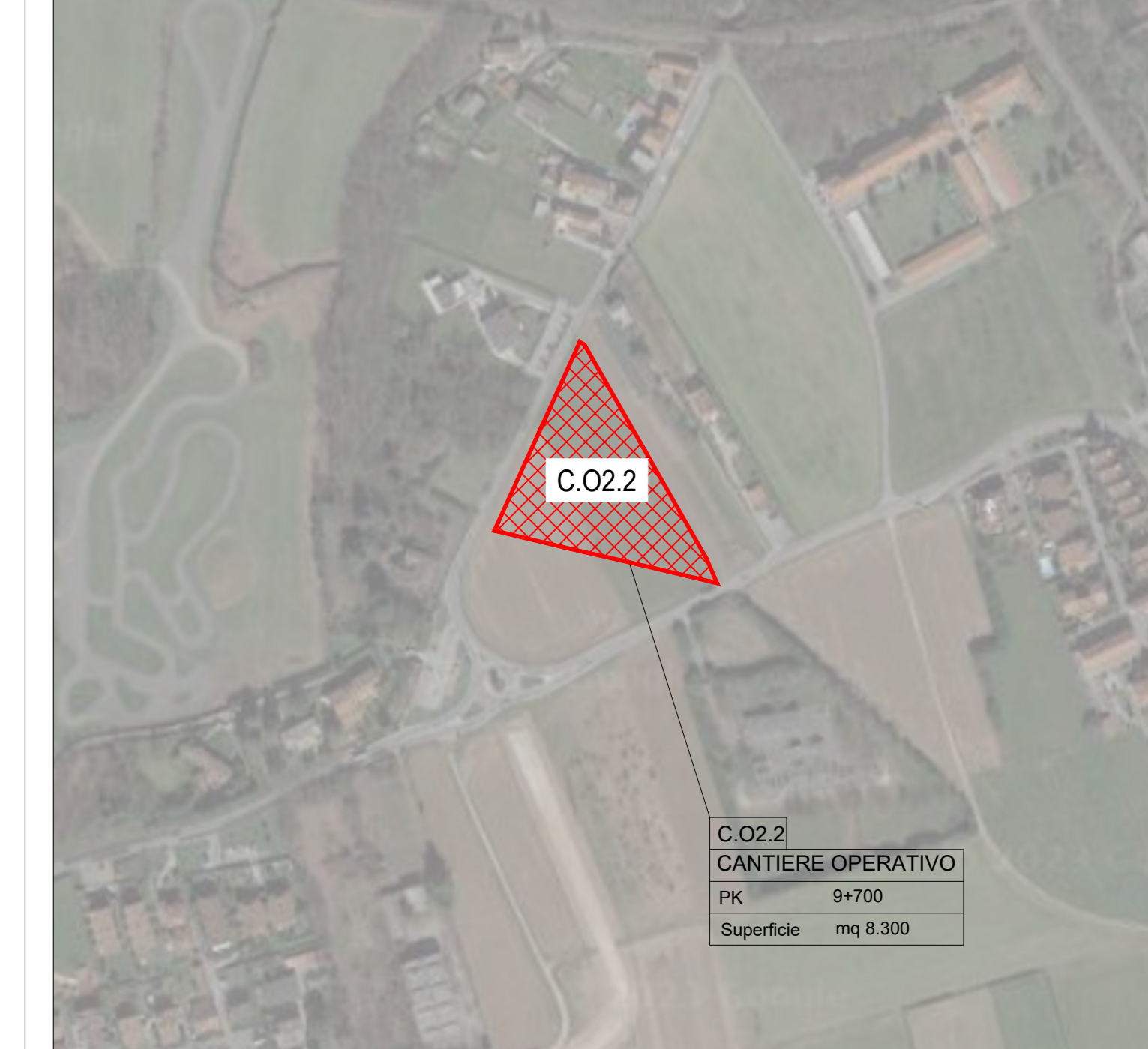
Localizzazione cantiere operativo su orofoto