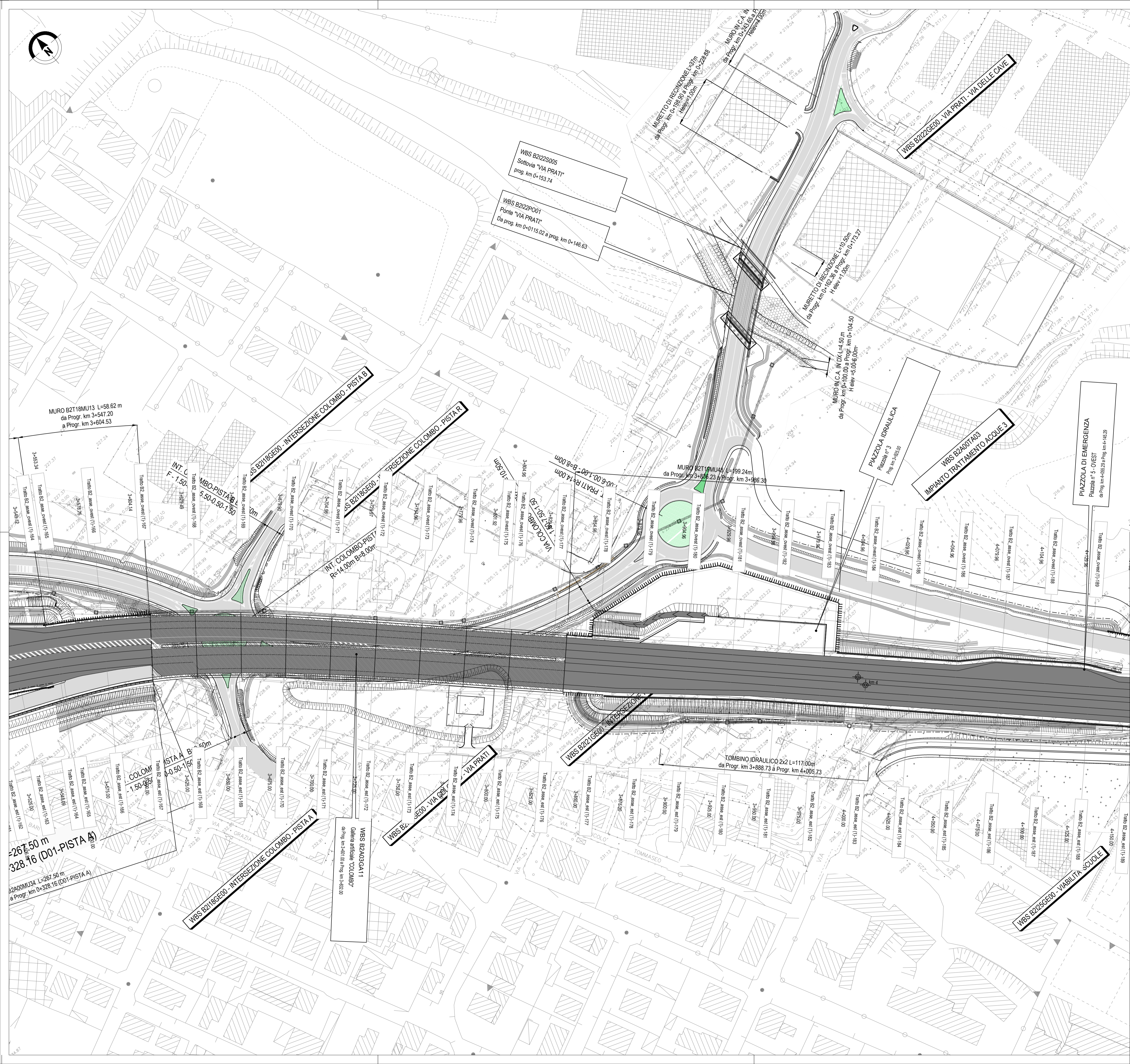
QUADRO DI UNIONE ASSE PRINCIPALE TRATTA B2