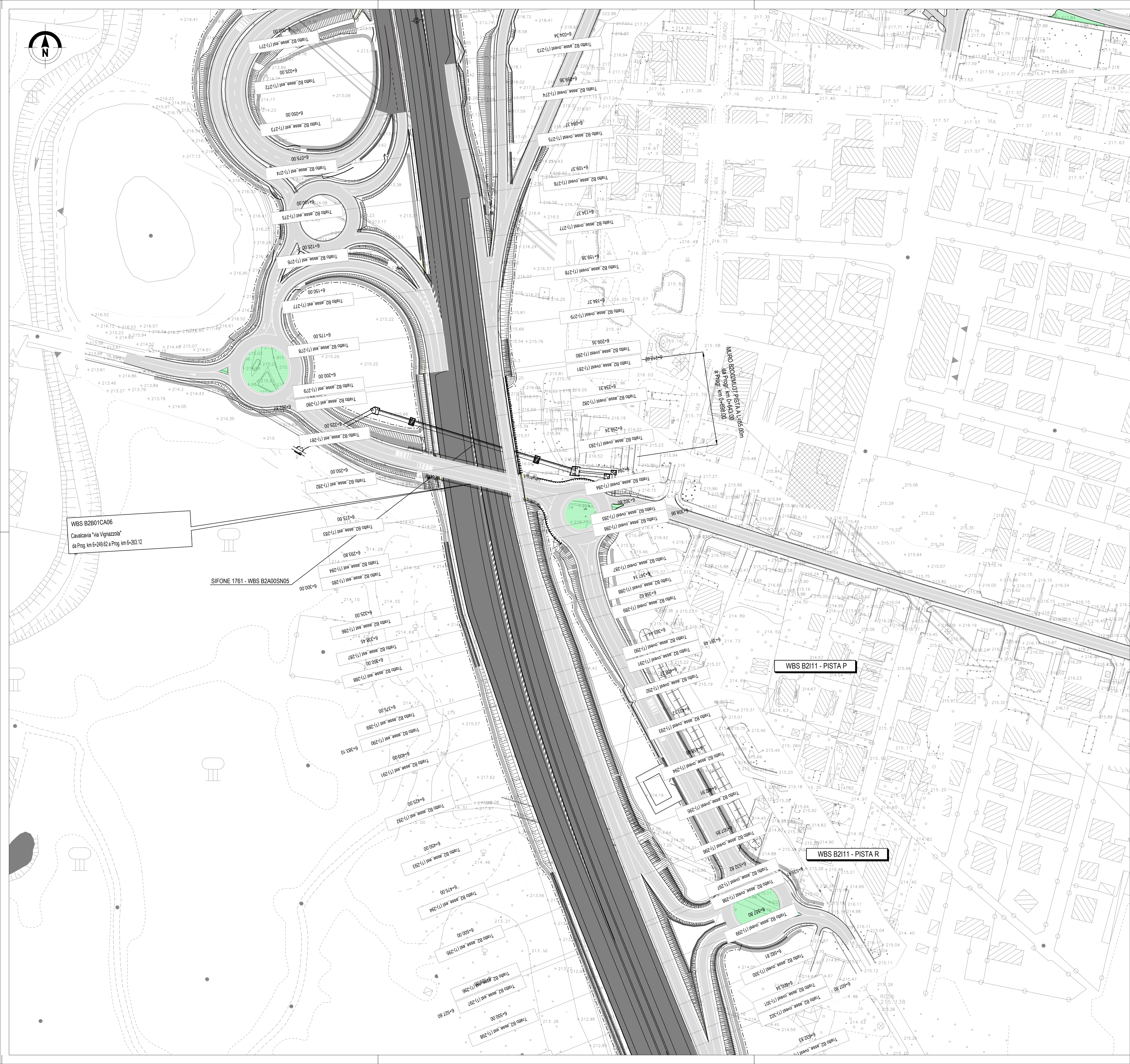
QUADRO DI UNIONE ASSE PRINCIPALE TRATTA B2